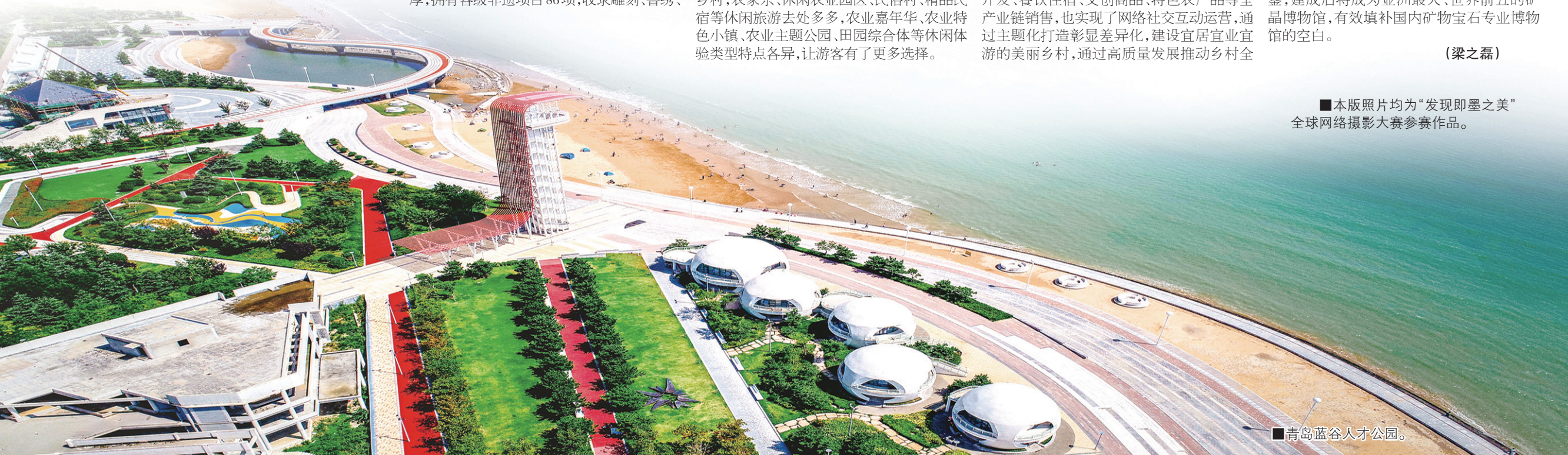
■ 青岛蓝谷人才公园。