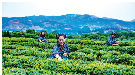
■ 鳌山卫“茶香梅谷”重点发展茶叶、梅花种植加工、休闲观光产业。