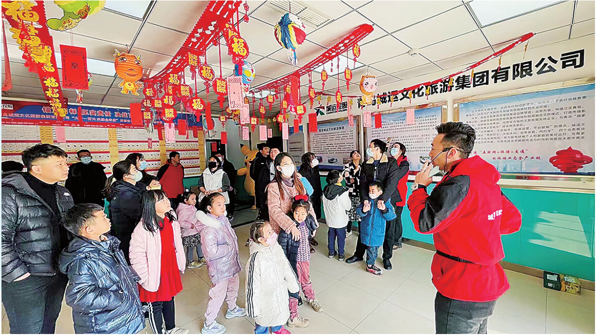
■研学旅游作为旅游新业态广受关注。

与此同时,围绕海洋等特色优势资源,近年来,我市先后出台了《关于推动青岛市海洋研学旅游高质量发展的意见》《青岛市研学旅游示范基地(营地)评定和管理规范》等政策文件,提出了对研学旅游项目的奖励扶持措施,举办了青岛(青岛)研学旅游创新发展大会、青岛海洋研学旅游设计大赛、中国研学旅行及教育产业博览会等节会赛事活动,搭建了青岛市研学旅行协会、青岛市研学旅行基地协会等行业组织平台,整合胶东五市研学旅游资源,发起设立了胶东研学旅游产业联盟,研学旅游产业发展高地正逐渐形成。在一系列利好推动下,青岛研学旅游产业不断向着大纵深、多层次、链条式发展,“海洋研学旅游首选目的地”正逐步构建。