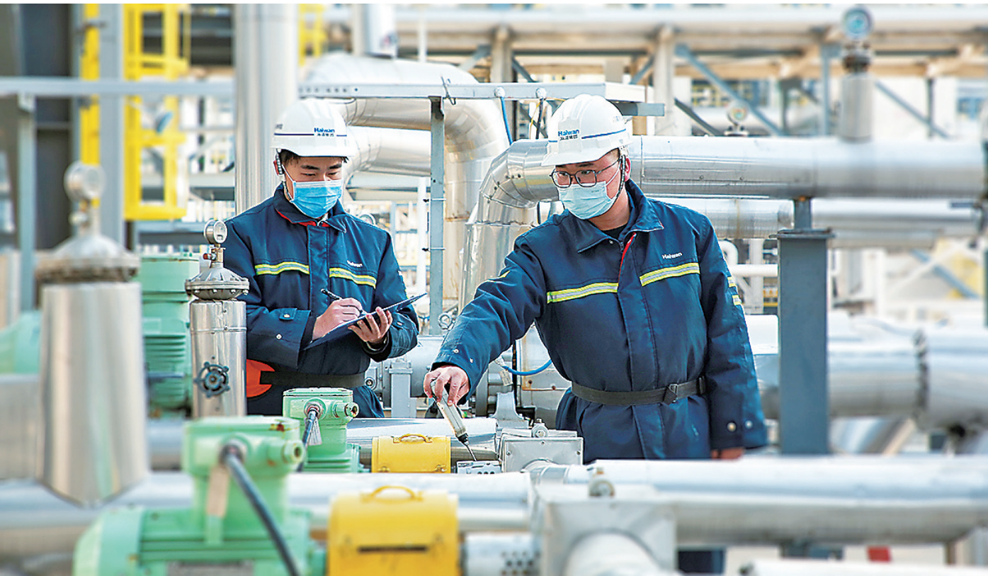
■ 海湾化学员工在生产线上巡检。