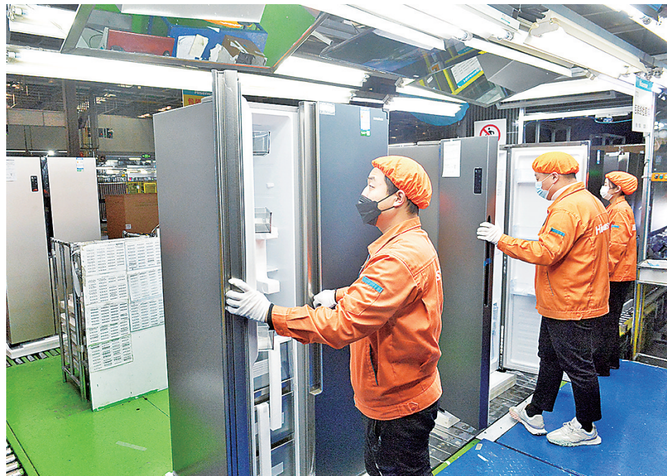
■ 海信(山东)家电产业园内，5条冰箱生产线全面投产，大风冷冰箱日产量达到3000台。