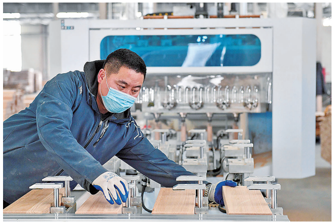
■ 源氏木语的工人使用数控机床加工榫卯组件。