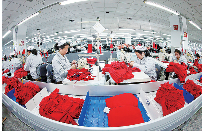
■ 即发集团工人正在生产出口服装产品。