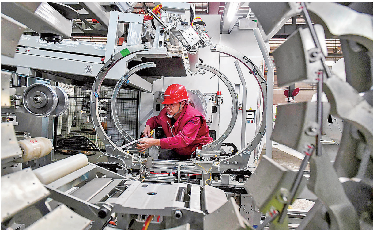
■ 软控装备产业园技术人员正在组装调试智能化轮胎成型机。