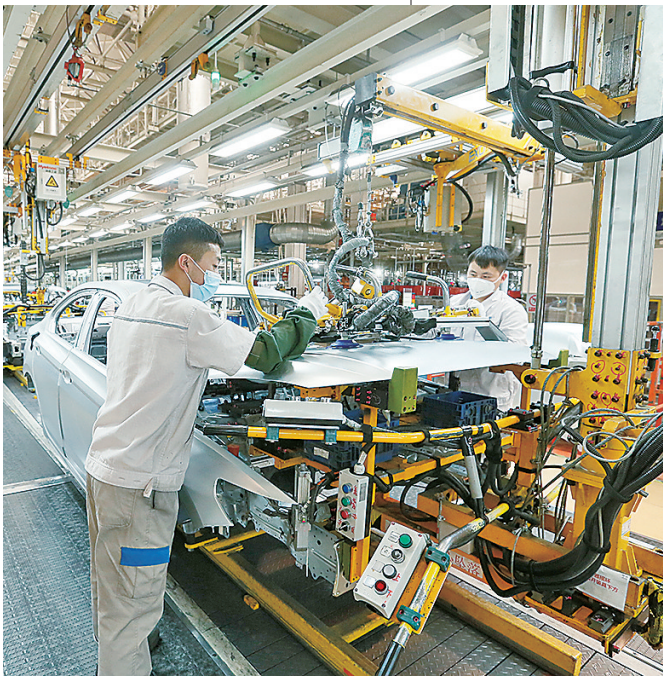
■ 一汽大众华东基地总装线一片繁忙景象。

数控加工中心生产线有条不紊快速运转；流水线上，一系列加工操作行云流水；车间里，无人值守机器人操作自如……开局之年的初春，青岛制造业一片繁忙景象。