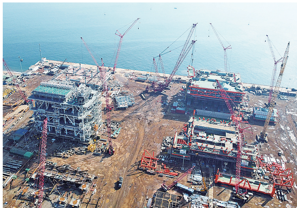
■ 海洋石油工程(青岛)有限公司的15项在建工程项目全面施工。