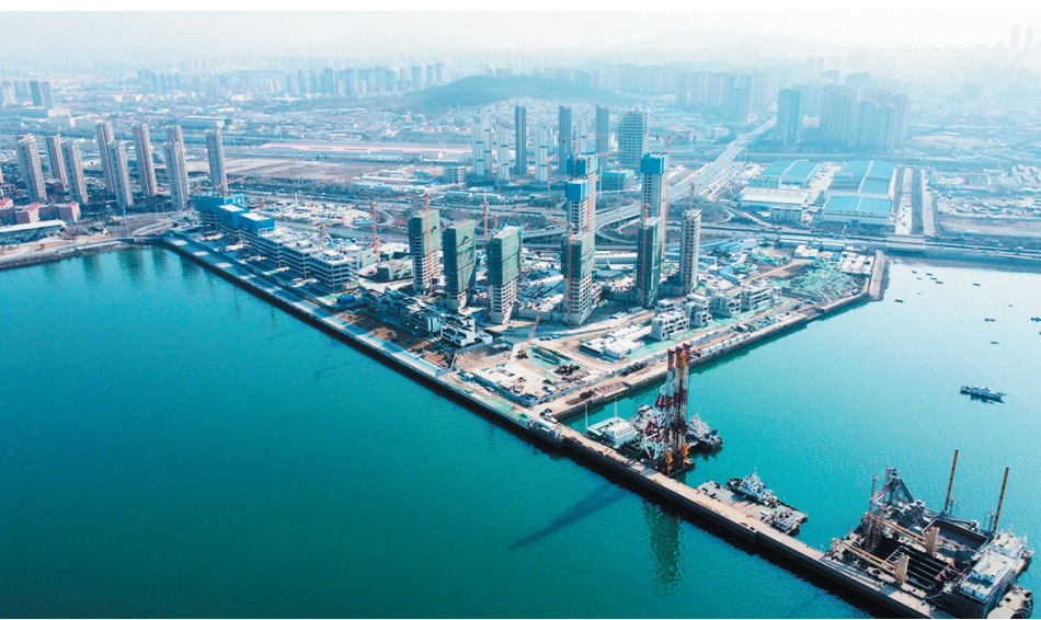
青岛人工智能产业集聚区。

招商方面,青岛人工智能产业集聚区将结合头部企业在人工智能领域的特色产业,以智能轨道交通为突破口,以工业互联网、金融科技、智能教育、智慧医疗等为集聚区特色产业重点培育方向展开招商及产业孵化。计划引入一家在城市轨道交通行业拥有国际领先列车自主运行控制等核心技术的企业入驻。市北区还将引进培