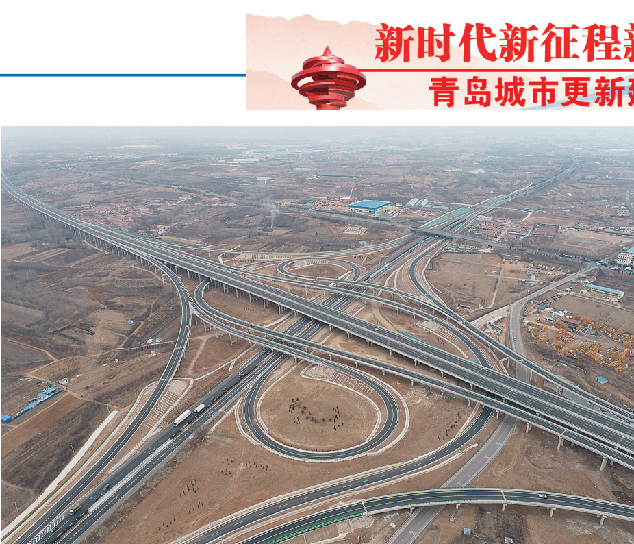
潍青高速胶州三里河互通建成后。