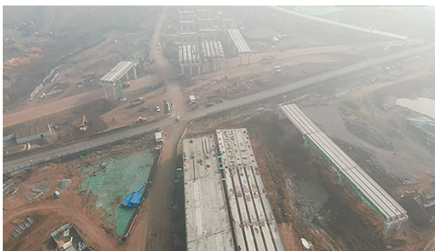
潍青高速胶州三里河互通建设初期。

宽阔的车道、平坦的路面、清晰的标线……在潍坊至青島高速公路(以下简称“潍青高速”)及连接线上,一辆辆客货车通过这条崭新的道路快速往返于青島、潍坊之间,川流