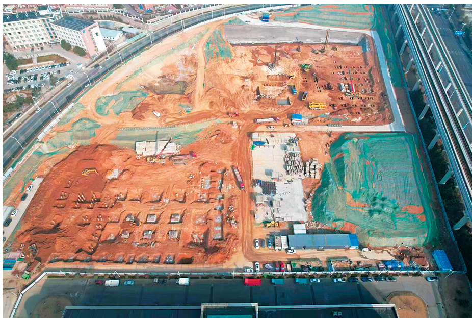
■一汽解放(青岛)商用车研究院主体建筑即将“拔地而起”。

但研究院的系列创新成果已经覆盖燃油车、新能源汽车以及智能驾驶等相关领域。例如，在燃油车系列车型开发中，研究院面向快递、快运、冷链、危化运输等高效长途干线市场，研发生产了新一代高端重卡系列产品“鹰途”。在预见性自适应巡航PACC、主动格栅、电控APU等多项行业首创技术加持下，该车型百公里油耗比主流产品降低3至4升，每年平均节省燃料成本34万至45万元，去年产销200台，预计今年产量将达到3000台。