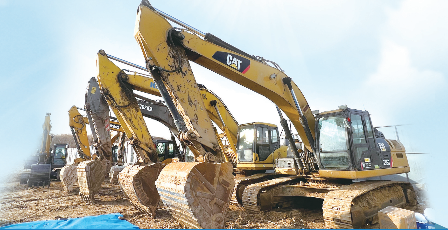
■ 工程机械就位，青岛 Club Med 地中海俱乐部项目开工。

作为城市更新和城市建设的主阵地、主战场，各区市以“起跑就是冲刺”的状态，倒排工期、挂图作战，快速掀起大于快上的项目建设新热潮，力争以一季度“开门红”引领全年“满堂红”。