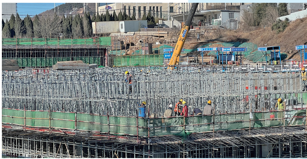
■青岛市虚拟现实产业园整机和光学模组项目加速推进施工。

聚焦重点工作谋划全年任务,加快掀起抓项目促发展热潮,各区市的系列动作,提振士气、鼓舞人心,展现出青岛热情饱满、斗志昂扬的精气神。