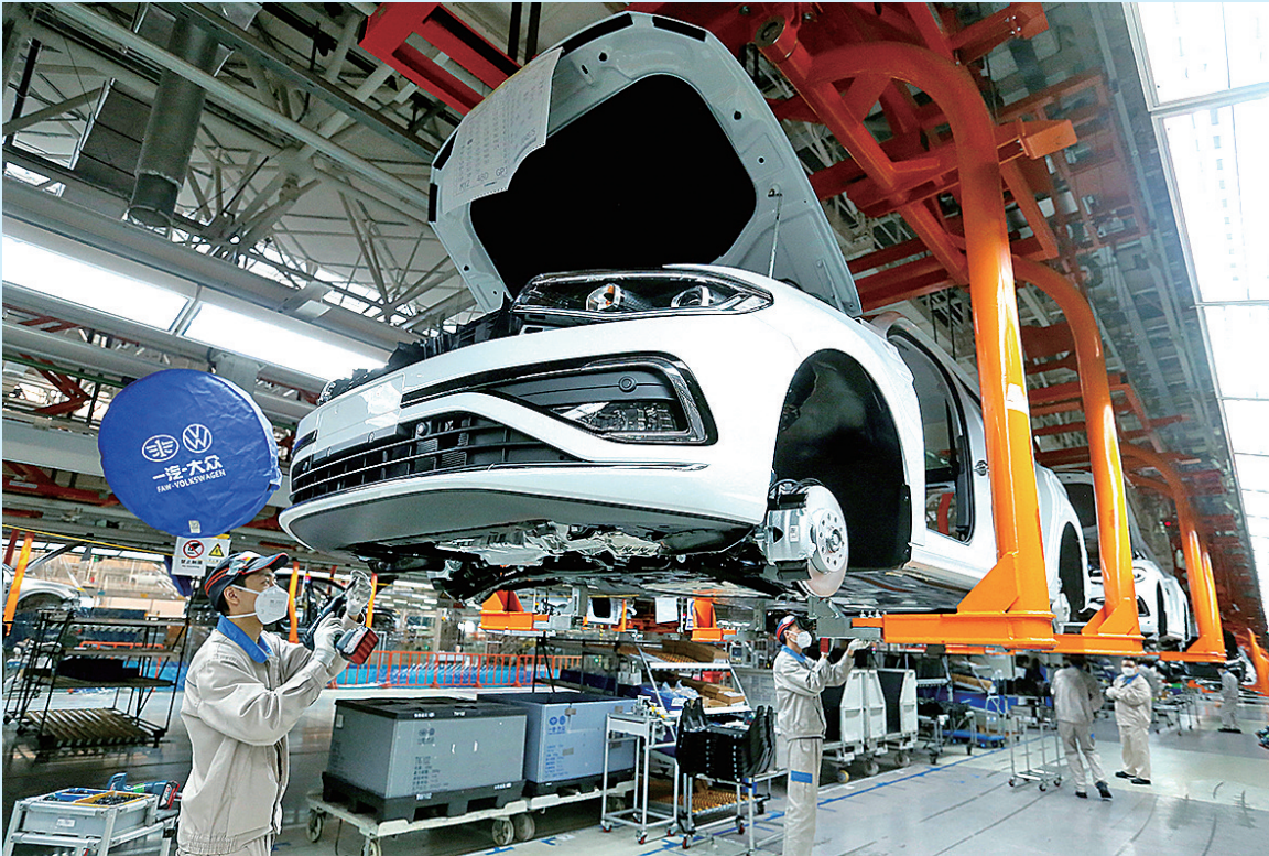
■一汽大众华东基地总装配车间的工人在生产线上忙碌。

作为城市更新和城市建设的重要战场,市南区明确,要抓好城市更新和城市建设各项工作落实,加快项目建设、强化为民服务、提速历史城区焕新,让城区环境更美好、发展空间更广阔、产业基础更坚实。锚定旅游品质提升六大攻坚行动126项任务,全力攻坚突破,全面提升城区品质,争创省级全域旅游示范区。