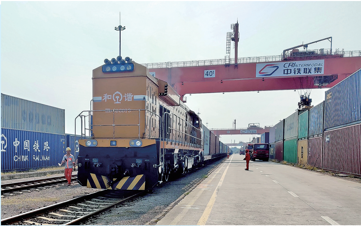
■中欧班列(齐鲁号)“上合快线”海尔家用电器专列从上合示范区多式联运中心发出。