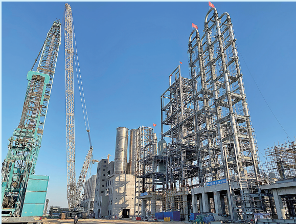
■金能化学二期项目正在紧张施工。

百年中山路首届逛街里节、首个互动装置艺术展;百年栈桥首个沉浸式激光秀、首场无人机表演;百年大鲍岛首届春节民俗市集……春节期间,西部老城区人流量激增。延续历史文化、创造现代气象,城市更新和城市建设引发的变化让人欣喜。