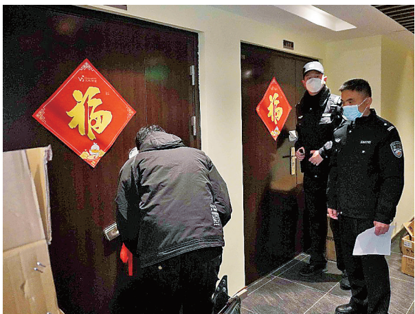
■黄岛法院执行干警到涉案房屋现场强制腾迁。