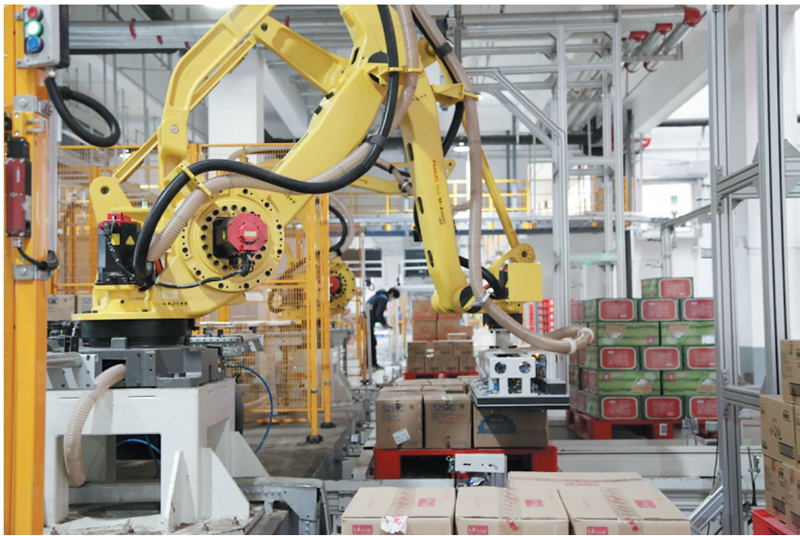
■利群胶州智慧物流及供应链基地拆垛机器人作业现场。

贯彻落实二十大精神,青岛各大企业加压奋进,正以积极进取、时不我待的精神状态扛起担当,冲锋在前。