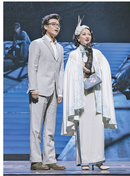
金星主演的舞台剧《日出》。

复。同时，2023年演出项目的策划也比往年更加提前，除已经开票的音乐诗画《听此青绿——乐咏千里江山》、芭蕾舞剧《天鹅湖》、《中央民族乐团音乐会》外，观众们期待已久的“舞坛双子星”最新破圈力作舞剧《咏春》、舞蹈家杨丽萍主演的舞剧《孔雀》、陈佩斯执导的舞台剧《惊梦》、中国东方演艺集团新作舞剧《东坡》以及著名演员刘敏涛与天津人艺合作的话剧《俗世奇人》等将陆续排期上演，开年重磅上新，精彩值得期待！