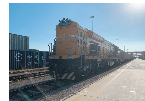
■2023年全省发出的首班中欧班列(齐鲁号)“日韩陆海快线”。