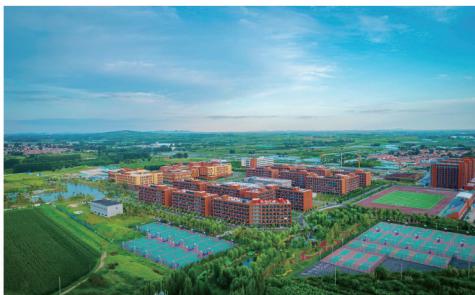
山东文化产业职业学院现状图

康职业学院和三甲医院构成的“一园一校一院”开展工作,加速推进物流园、青岛南路西、芝罘路南等剩余3个片区2200余亩土地收储工作,给各类重点项目建设“腾地让道”。目前在收储的低效土地上,优先启动总投资16.2亿元的山东文化产业职业学院、总投资8亿元的国际足球学校、总投资10亿元的梦想望城旧村改造项目。在谈项目3个,总投资57亿元,分别是投资20亿元的国际陆港项目(投资主体为山东高速和山东港口集团,已腾空土地231.35亩)、投资15亿元的胶东国际木材市场项目(引入青岛龙盛达建材社会资本,已完成搬迁清场,场内主要道路铺设完成,污水管道等基础设施正有序建设)和投资22亿元的青岛卫生健康职业学院项目(与青岛卫健委达成战略合作意向,已腾空土地504亩),全力打造青岛市低效片区开发建设样板区。