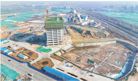
国际足球学校现状图