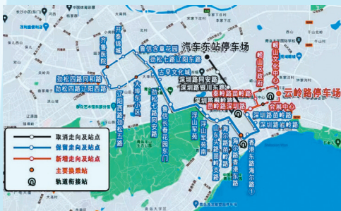
■公交场站及线路调整图。