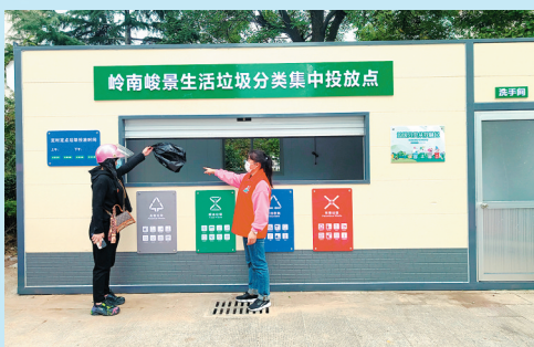
■小区新增的密闭分类投放点。