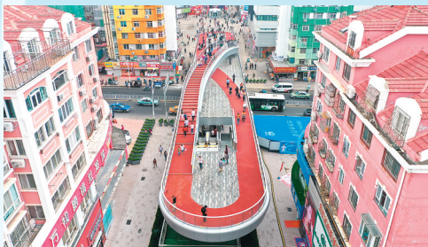
■台东三路人行天桥。