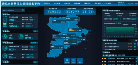
■青岛市智慧停车管理服务平台。