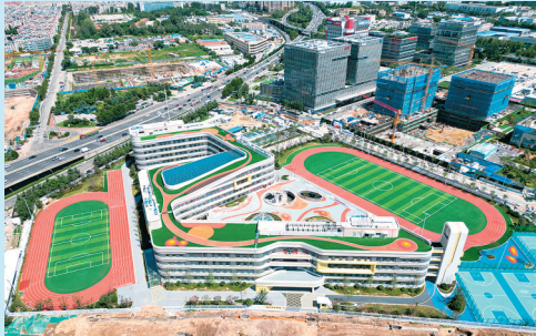
■建成后的海尔路学校。