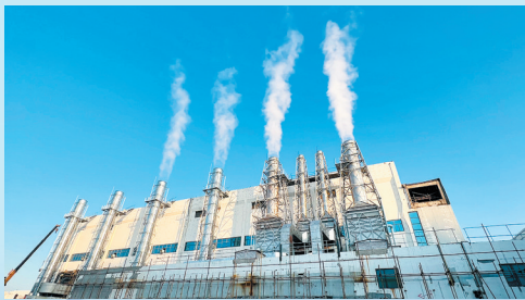
■“煤改气”后的二热徐家东山热源。

■第1件:实现城镇新增就业35万人以上,创设公益性岗位3.7万个以上,完成扶持创业3万人以上、农民技能培训2万人以上。(责任单位:市人力资源社会保障局、市农业农村局)