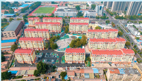
■改造后的胶州常乐花园。