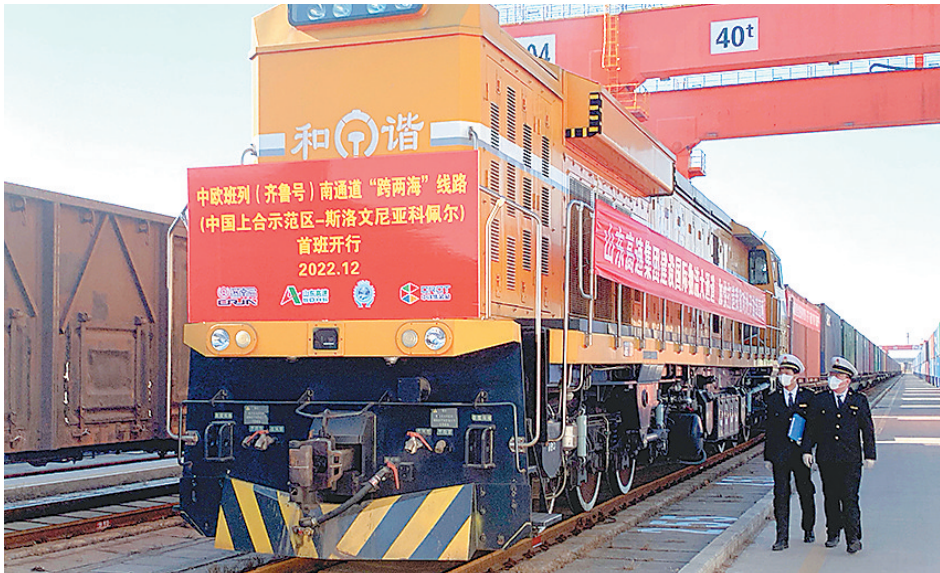
中欧班列(齐鲁号)在青岛跑出“加速度”,国际班列线路已扩展至19条。

扎实推进上合示范区、山东自贸试验区青岛片区建设,积极开展首创性、差异化探索;聚焦抓好实体经济和招商引引资、城市更新和城