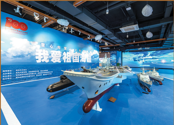
■“我爱祖国海疆”研学体验馆。

跟随辽宁舰编队出海执行训练任务、搭乘“蛟龙号”一起深海探险……在“我爱祖国海疆”研学体验馆，孩子们可以借助VR、体感互动座椅等智能化装备，来一次身临其境的海洋国防沉浸式体验。