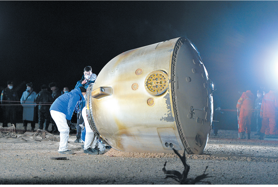
■12月4日20时09分,神舟十四号载人飞船返回舱在东风着陆场成功着陆,现场医监医保人员确认航天员陈冬、刘洋、蔡旭哲身体状态良好,神舟十四号载人飞行任务取得圆满成功。