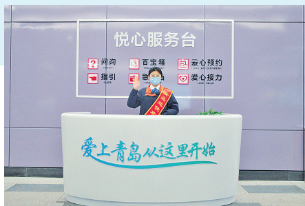
■地铁站成为展示城市文明形象的重要窗口。

党的二十大报告提出,加强城市基础设施建设,打造宜居、韧性、智慧城市。张君表示,在二十大精神指引下,青岛地铁将继续秉承“为人民建地铁、为城市建地铁”的理念,聚焦城市更新建设攻坚行动,深入推进地铁建设和地铁沿线开发建设,加快建设“双一流”地铁,为乘客打造更有温度、更舒适、更便捷的出行空间,为城市高质量发展当好“开路先锋”。