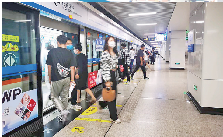
■地铁已成为青岛市民出行的重要交通工具。