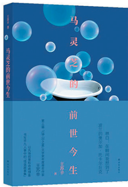
《马灵芝的前世今生》 王苏辛 著 译林出版社

自称“长三角地区最懒的小说写作者”三三的短篇小说集。晚年与旧爱重逢者、黎曼函数的研究者、一场家宴的参与者、收到补天者求救信息的人……进入人生循环的人们，寻找着“脱轨”的瞬间。三三直指生命的孤独本质，也给从深水中上岸的人们带来疗愈。