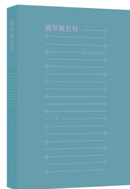
《俄罗斯套娃》 三三 著 译林出版社

不久前，黎紫书、笛安和张怡微进行了一次主题为“远游与回归”的线上交流。三位成熟的中文写作者创作