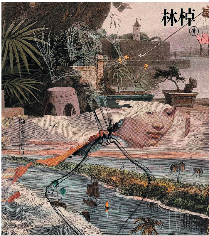
《潮汐图》 林棹 著 上海文艺出版社