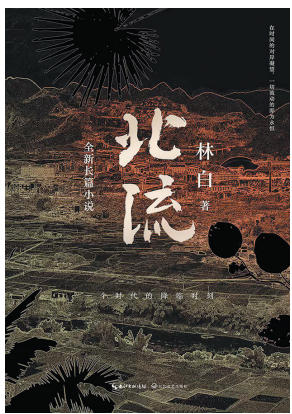
《北流》 林白 著 长江文艺出版社