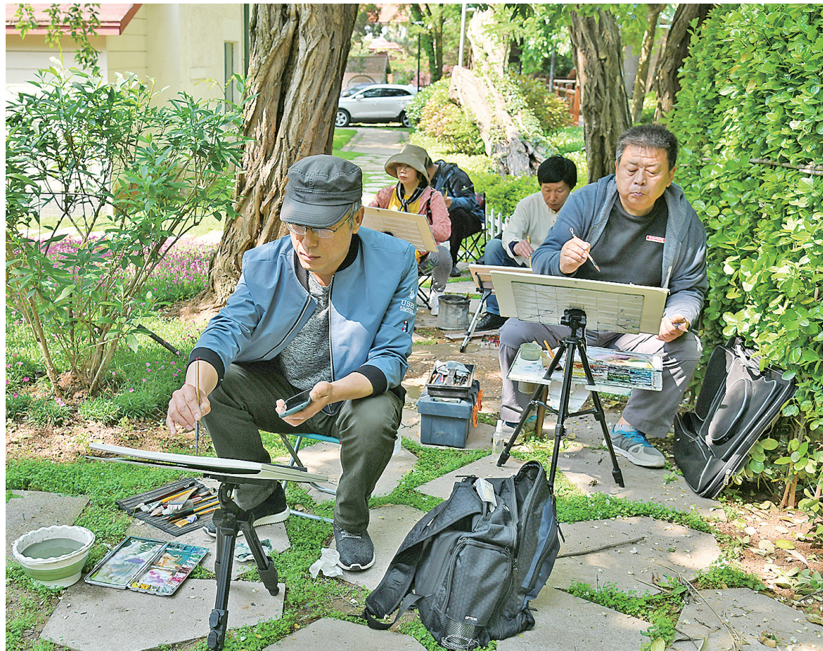
水彩画家们在八大关写生。

风吹过青岛的街道，与大海咸湿的氤氲互致问候。回声以水彩画的姿态，过滤为一座城市的百年文艺风景。滨海的青岛天生丽质，是世界上最适合用水彩画表现的城市之一。因了这种美景与美术“美美与共”的双向奔赴，国内美术界素有“中国水彩看山东，山东水彩看青岛”的说法。本月下旬，青岛将举办“水彩让城市更精彩”——首届中国当代水彩画邀请展暨水彩画学术论坛。活动分为首届中国当代水彩画邀请展、青岛特别展区水彩作品展、中国水彩画学术论坛和名家邀请写生活动三个板块，引入国内前沿的当代水彩画艺术新观念。