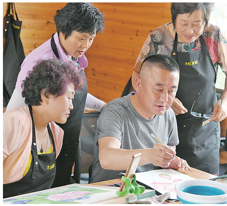
大石村的农民们纷纷拿起画笔创作水彩画。