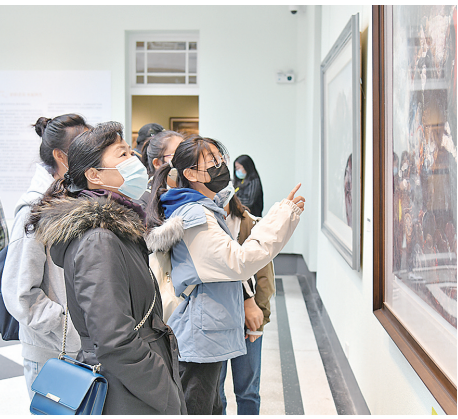
2021年10月，“中国美术馆学术邀请系列展——青岛水彩”汇报展在青岛市美术馆举办。