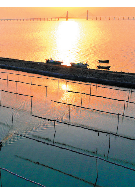
■田横“蓝湾薯乡”,沿山发展地瓜种植加工特色产业,沿海发展生态养殖。图为海水养殖基地。

治国之道,富民为始。党支部一头托起产业发展,一头连接百姓致富,无时无刻不在发挥着强大的组织力,而这种组织力必将转化为生产力、群众的致富力,推动即墨区向实现多方共赢、共同富裕又迈进了一大步。