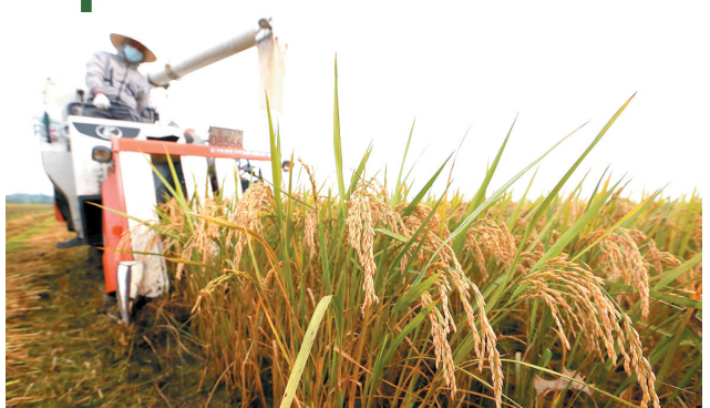
■蓝村“桃源稻香”,发展羊肚菌、水稻等采摘休闲农业。图为蓝村水稻收割现场。

立足新发展阶段,如何推动乡村振兴、促进共同富裕是即墨的重要课题。 撤市设区五年来,即墨大部分区域仍是农村形态,要实现全域振兴,打造乡村振兴隆起带成为当务之急。即墨区把乡村振兴作为“三农”工作总抓手,坚持“党建统领、产业支撑、生态宜居、城乡融合、共同富裕”,全力打造乡村振兴齐鲁样板先行示范区,促进点、线、面一体联动;扭住人居环境整治这项群众感受最直观、最实在的工作,促进区、镇、村上下联动;夯实基层组织基础,发挥服务保障作用,促进党员、干部、群众同心联动。 2021年,即墨区农业总产值150余亿元,获评山东省农产品加工业示范县。一幅农业强、农村美、农民富的斑斓画卷正在这片沃土上铺展开来。