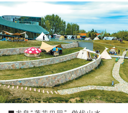
■龙泉“莲花田园”,做优山水田园,保持原乡风貌,重点发展特色农旅、文旅产业。图为“莲山胜境”游客服务中心。