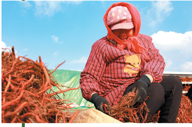
■灵山“花乡药谷”,重点发展中药种植、中医药加工等产业,聚力打造青岛市生物医药和中医药产业贸易集聚区。图为村民在收获药材。

每逢春季,位于即墨区龙泉街道的千亩蜜桃基地成了无数市民的打卡地,周边的每一处景观都是村民增收致富的“摇钱树”。一条莲藕绵延数公里,串联起台子、张家庄、石门、汪南等10个村庄和100余家休闲庄园、家庭农场,依托山、水、湖、泉、湾等资源,这里正在打造以“乡村旅游”为主的乡村振兴齐鲁样板。