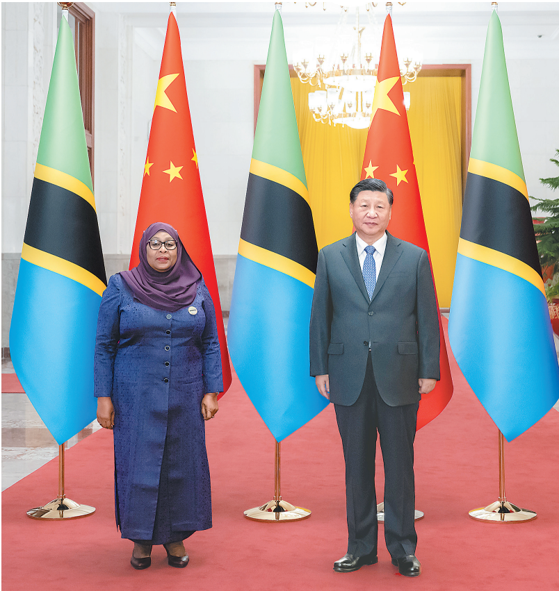
11月3日下午,国家主席习近平在北京人民大会堂同来华进行国事访问的坦桑尼亚总统哈桑举行会谈。这是会谈前,习近平在人民大会堂北大厅为哈桑举行欢迎仪式。