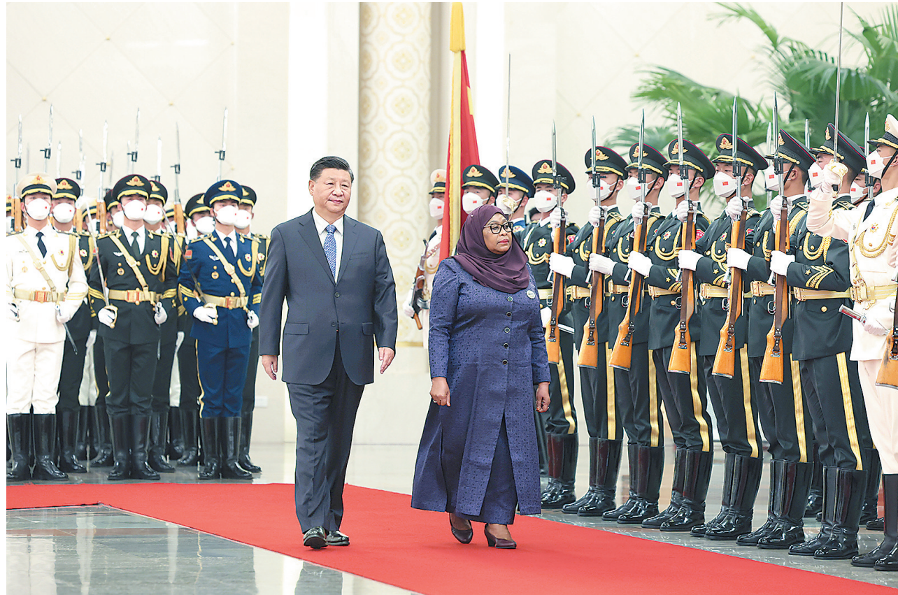
11月3日下午,国家主席习近平在北京人民大会堂同来华进行国事访问的坦桑尼亚总统哈桑举行会谈。这是会谈前,习近平在人民大会堂北大厅为哈桑举行欢迎仪式。