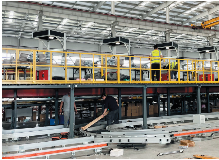
▲科捷智能科技股份有限公司入选“全国硬科技企业之星TOP100”。