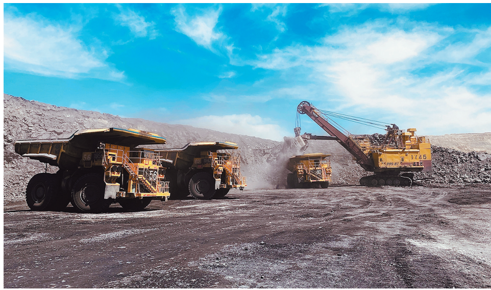
▲慧拓智能在某露天煤矿的无人驾驶矿卡项目。