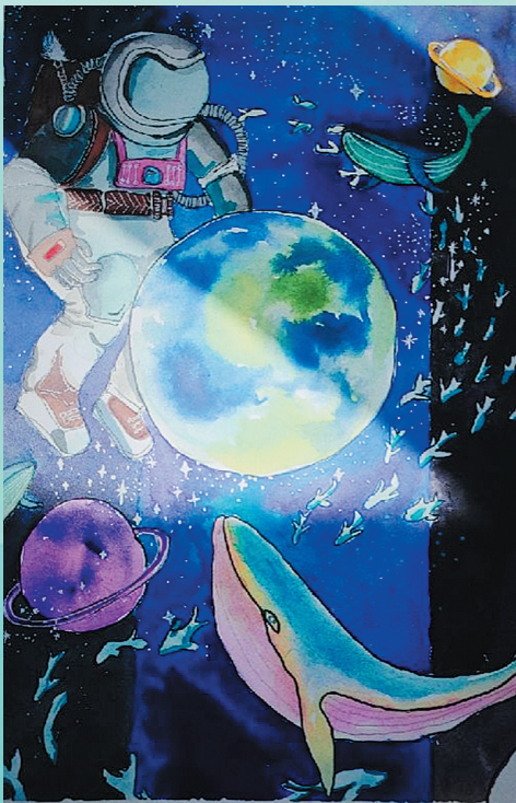
■《生命漫步》青岛超银中学 金沙校区2022级 王艺霖