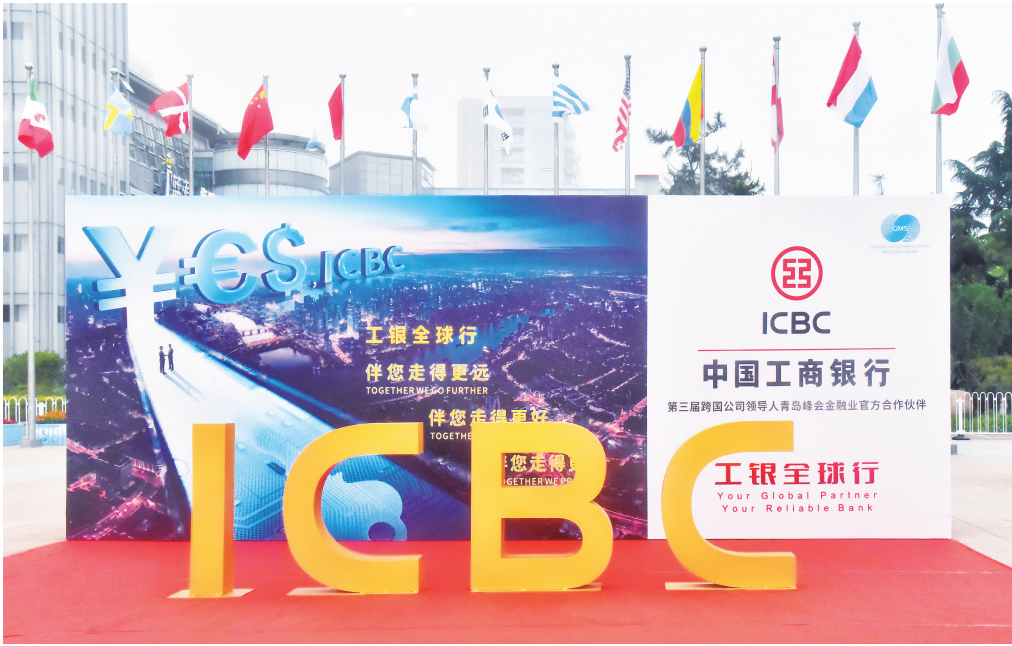
■第三届跨国公司领导人青岛峰会金融业官方合作伙伴

一项战略工作进行组织推进，把缓解民营和小微企业“融资难融资贵”问题，作为普惠金融的突破点，充分运用“数字普惠+”模式，坚持“持续降、主动免、全面纾”，为小微企业精准画像、有效增信、主动授信，开辟绿色审批通道，精准实施临时性延期还本付息，累计为1.5万户普惠客户发放贷款近700亿元，“真金白银”惠企纾困。 青岛工行紧跟青岛建设“乡村振兴齐鲁样板先行区”步伐，全面用好金融支持乡村振兴“十五条措施”，充分发挥工行与国网线上线下一体化和数字化的全方位渠道优势，共建全225家“电力+金融”乡村普惠金融服务点，搭建起“县城网点+农村服务点+使者”的线下渠道和“兴农通”App等线上渠道的乡村振兴触达体系。为企业量身打造“粮食收购贷”融资方案，截至2022年9月末，已累计发放涉农贷款350亿元。 助推“城市更新” 提升城市功能品质 普惠金融是实现共同富裕的强大动能，而城市更新则是实现居民共同富裕的重要途径，是提升城市品质的有力“抓手”。 围绕《青岛市城市更新和城市建设三年攻坚行动方案》工作要求，青岛工行迅速成立专职金融辅导团队，针对城市更新和城市建设项目清单全面开展攻坚行动。通过深入走访政府和企业，为600家企业开展现场辅导，实现了7个市辖、3个县级市和10余家市级、区级重点平台公司宣讲全覆盖，完成审批贷款超100亿元。其中，为崂山区张村河项目提供城市更新贷款40亿元，不仅是全市国有商业银行中的首笔城市更新贷款，也是迄今为止单笔金额最大的一笔城市更新贷款。