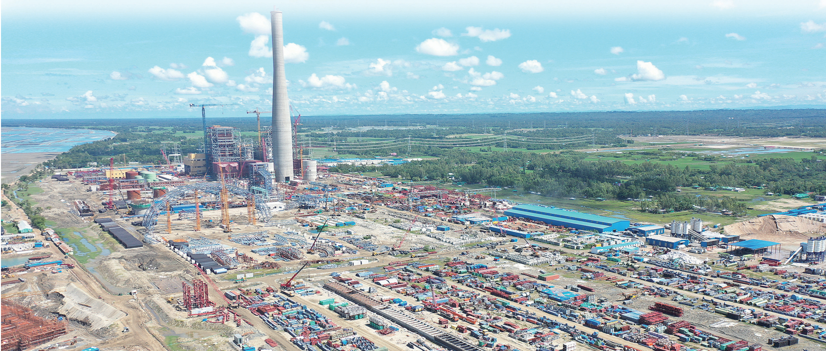
■中国信保山东分公司参与的孟加拉装机容量最大的燃煤电站项目。