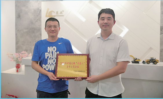
■中国信保山东分公司工作人员为企业代表颁发“小巨人”合作示范企业奖牌。