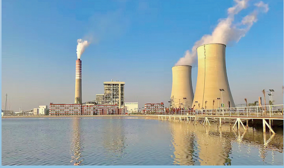
■巴基斯坦萨希瓦尔燃煤电站项目。