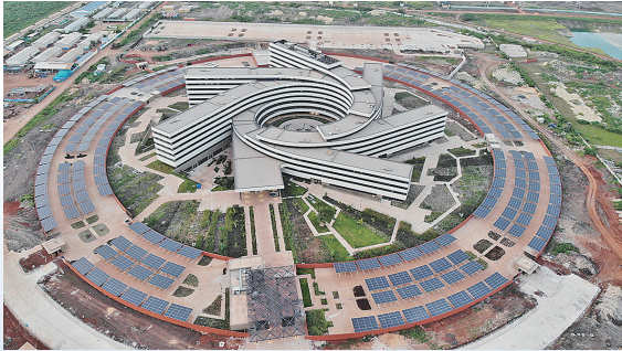
■威海国际经济技术合作股份有限公司投资建设塞内加尔联合国办公楼项目，入选首届中非经贸合作论坛(2019年)成果。

站在新的历史起点，在青岛聚力打造“国际门户枢纽城市”的开放路径之下，在风急浪高的国际贸易形势下，中国信保山东分公司将继续乘风破浪，激流勇进，以有效支持国家战略和精准支持企业发展的任务为业务导向，服务更高水平的对外开放。