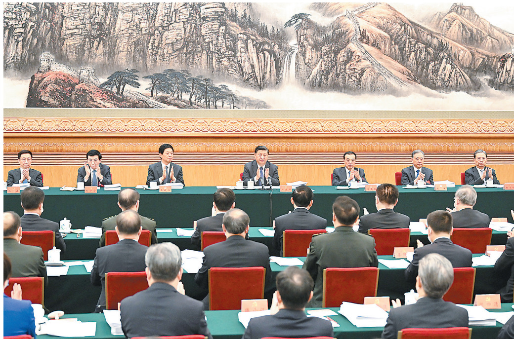
习近平、李克强、栗战书、汪洋、王沪宁、赵乐际、韩正等出席会议。