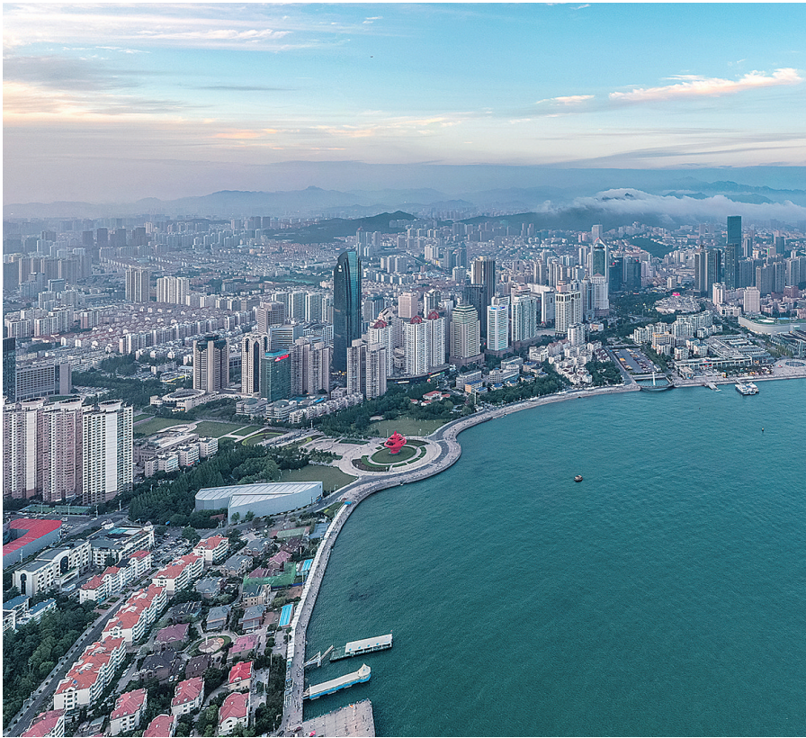
■航拍五四广场。

党的二十大报告中提出,要推进健康中国建设。市卫生健康委党组书记、副主任柳忠旭表示:“不管是面对新冠肺炎疫情还是新时代各项卫生健康工作,卫生健康系统的每一名工作者都将时刻不忘入职初心、牢记