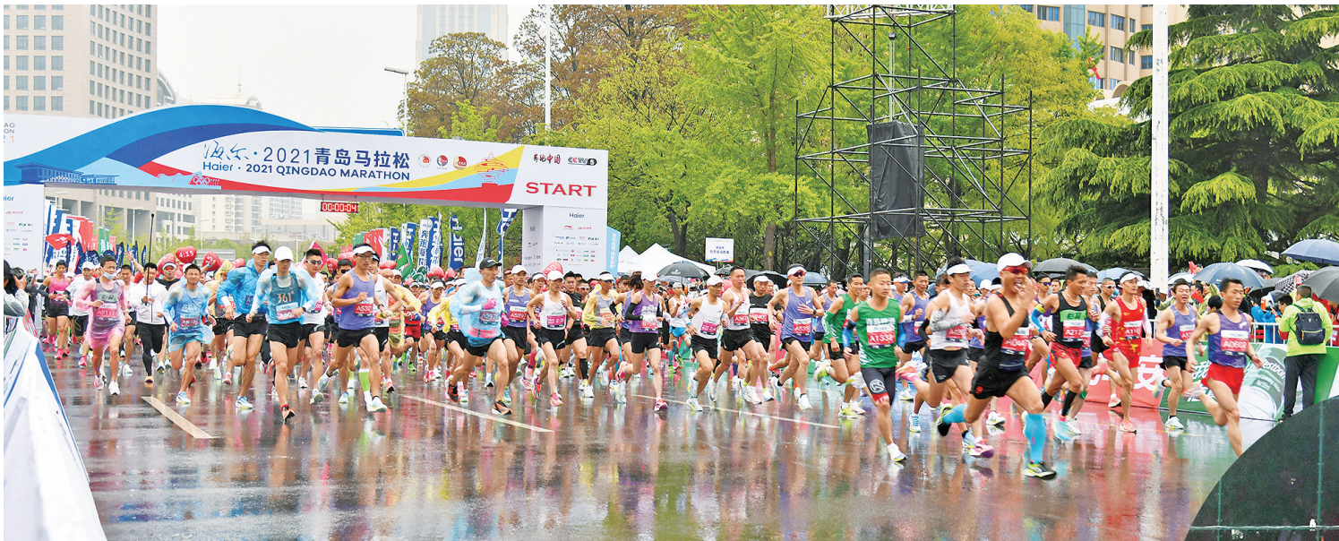
■2021年青岛马拉松比赛现场。