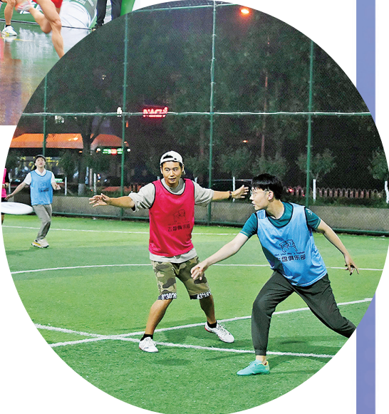
■飞盘在青岛已成为热门运动项目。

新冠肺炎疫情下，体育产业特别是接触性体育服务业受到冲击，青岛市先后出台了多项助企纾困政策。成立体育消费纠纷巡回法庭和体育产业诚信联盟，开辟“绿色金融服务通道”，举办中国·青岛时尚体育产业大会活动，采用财政、平台补贴，商户让利方式，持续发放体育惠民消费券，继续搭建和完善体育企业与消费者交流平台，促进体育经济，释放体育消费活力，繁荣体育市场。