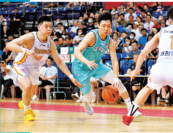
■青岛国信男篮在2022年CBA夏季联赛中称雄。

体育强则中国强，国运兴则体育兴。十年来，青岛体育被赋予全新的内涵和外延，体育强市建设蹄疾步稳，全民健身、竞技体育、体育产业协同发展，交出了一份人民满意的新时代“答卷”。