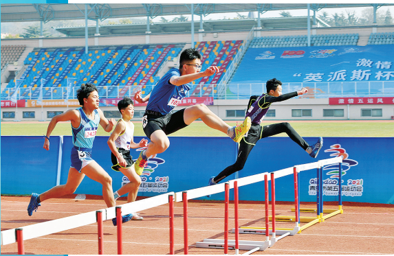
■2021年青岛市第五届运动会上激烈的比赛场面。