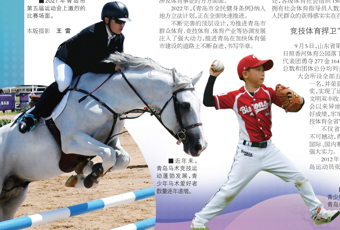
■近年来，青岛马术竞技运动蓬勃发展，青少年马术爱好者数量逐年递增。