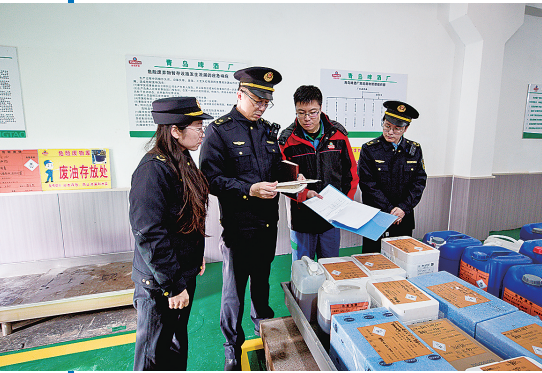
■生态环境执法人员开展执法检查，确保生态环境安全。