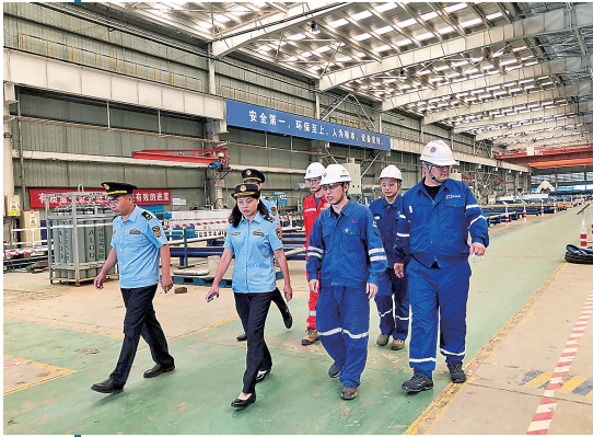
■生态环境执法人员到企业帮扶，助力绿色发展。