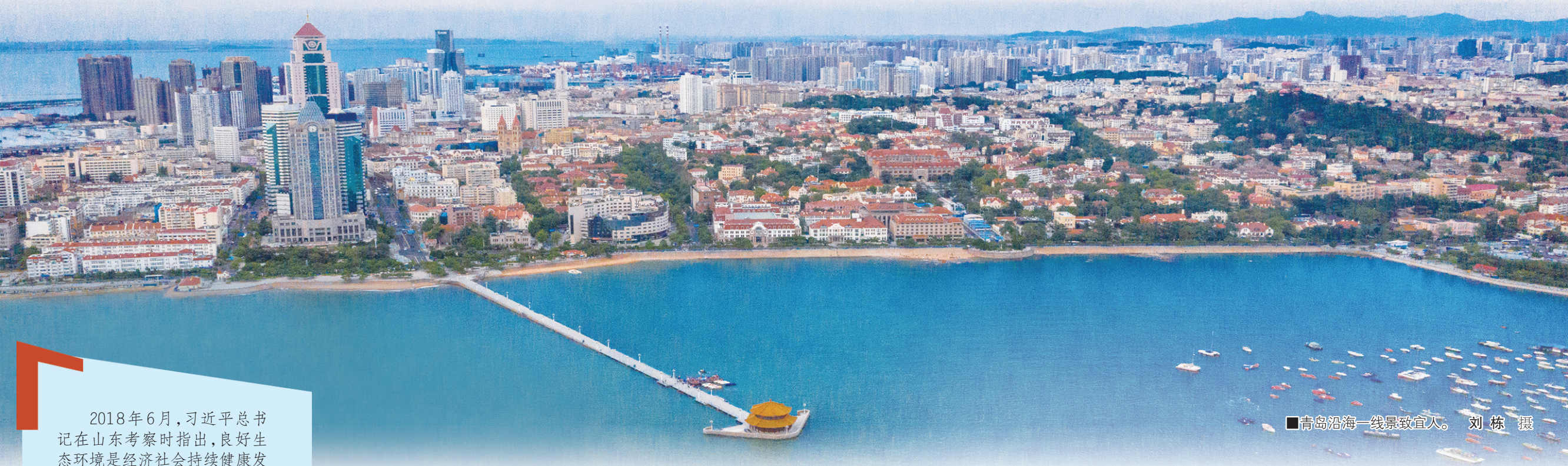
■青岛沿海一线景致宜人。

2018年6月，习近平总书记 在山东考察时指出，良好生态环境是经济社会持续健康发展的重要基础，要把生态文明建设放在突出地位，把绿水青山就是金山银山的理念印在脑子里、落实在行动上，统筹山水林田湖草系统治理，让祖国大地不断绿起来、美起来。