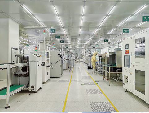
■青岛微电子产业园生产线投产。