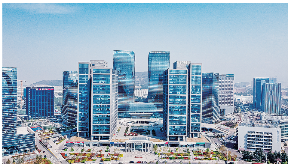
■青岛国际创新园远眺。

青岛镭测创芯科技有限公司是一家科技型中小企业,创造了多普勒激光雷达和环境遥感的多项国际“第一”。“公司在成立之初,就获得入驻众创空间的政策支持,不到一年时间便得到了崂山区属国有企业500万元的天使轮投资,成立短短四年多时间里,就实现了从“跟跑”到与国际“并跑”的跨越发展。”青岛镭测创芯科技有限公