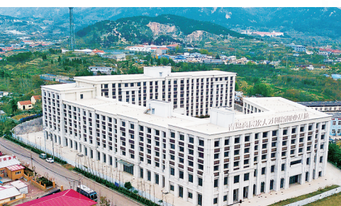
■青岛高层次人才创新创业基地。