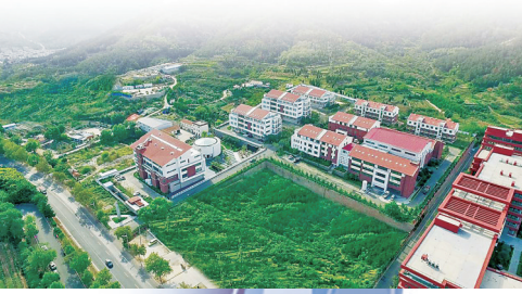
■青岛院士专家创新创业园。