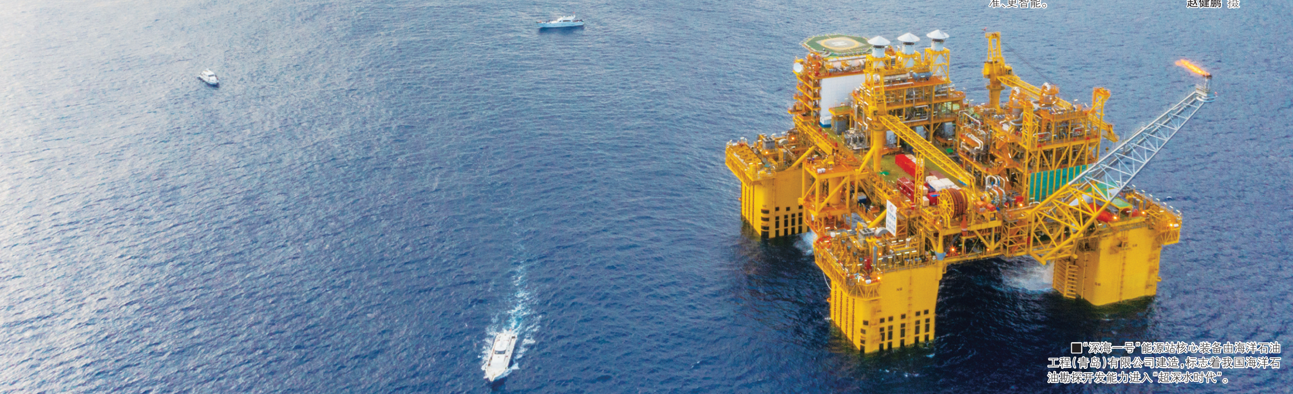
□“深海一号”能源站核心装备由海洋石油工程（青岛）有限公司建设，标志着我国海洋石油勘探开发能力进入“超深水时代”。