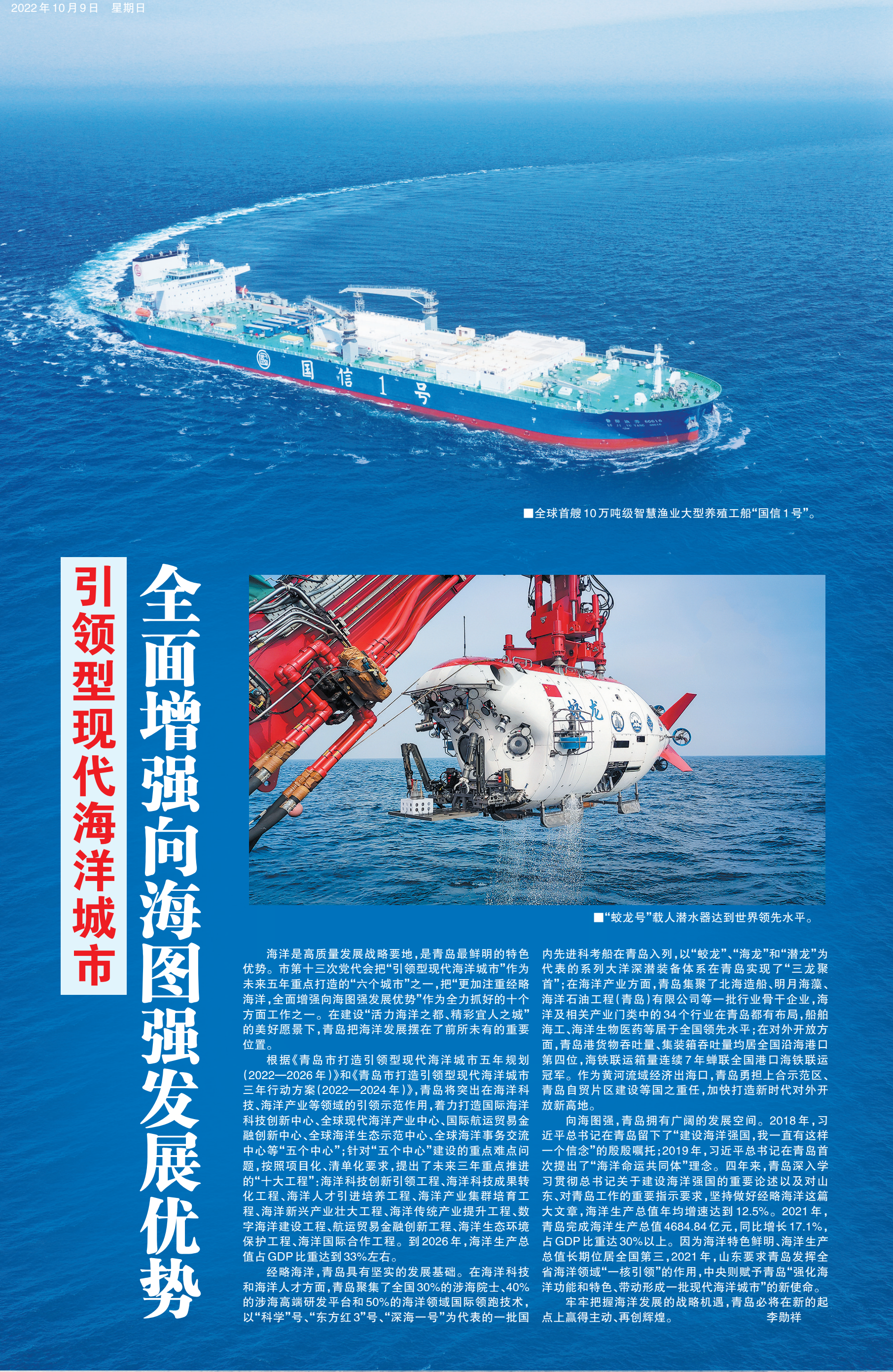
■全球首艘10万吨级智慧渔业大型养殖工船“国信1号”。