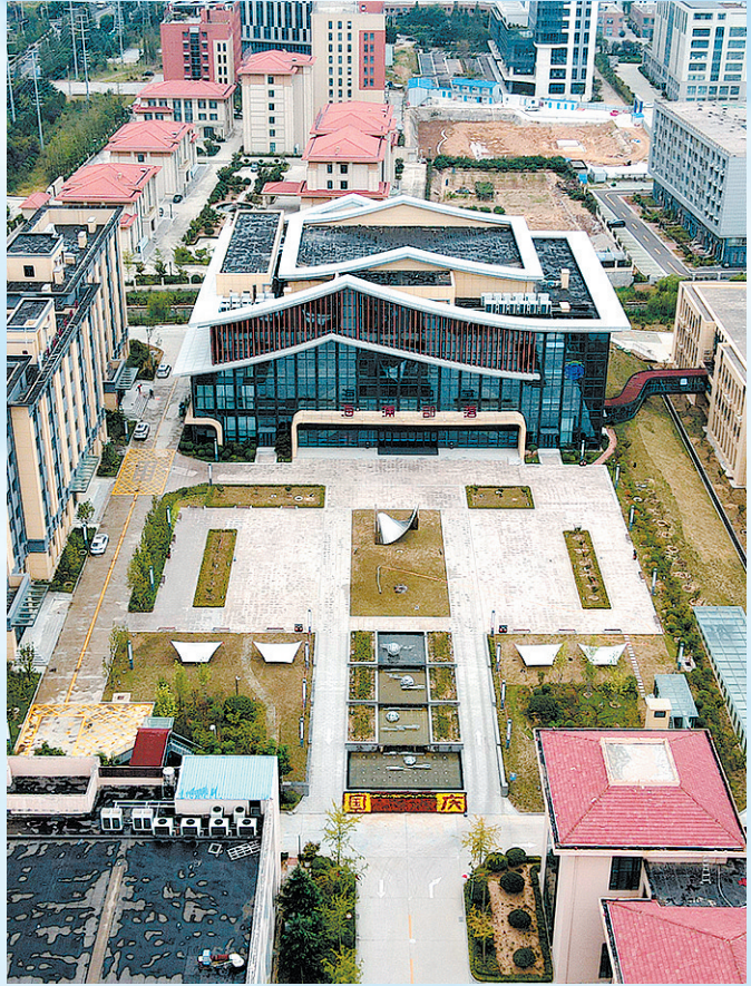
■青岛明月海藻集团有限公司是海洋生物医药领域的企业代表，被誉为“青岛新五朵金花”之“海洋之花”。