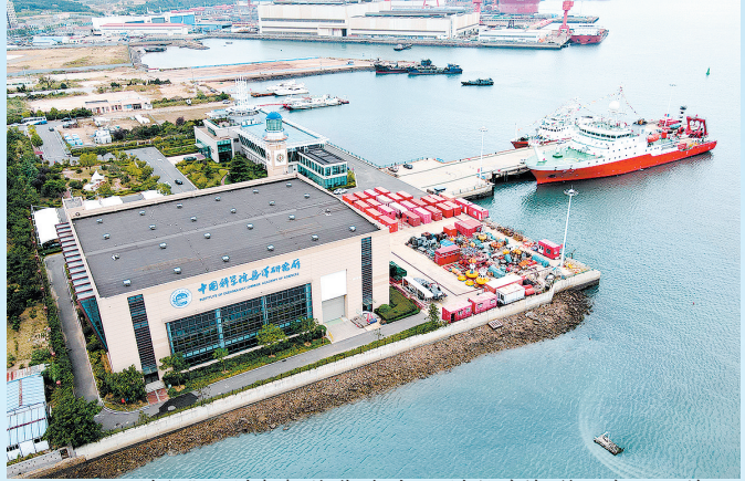
■“科学”号科考船停靠在中国科学院海洋研究所西海岸园区。