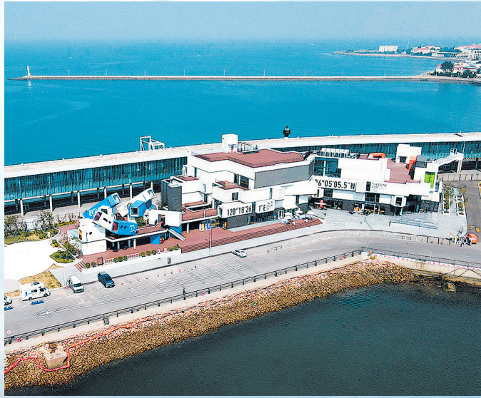
■邮联港区集装箱部落正式启用，该项目将成为一站式城市生活服务空间。