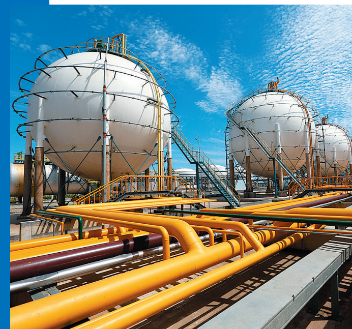
■海湾化学生产区。