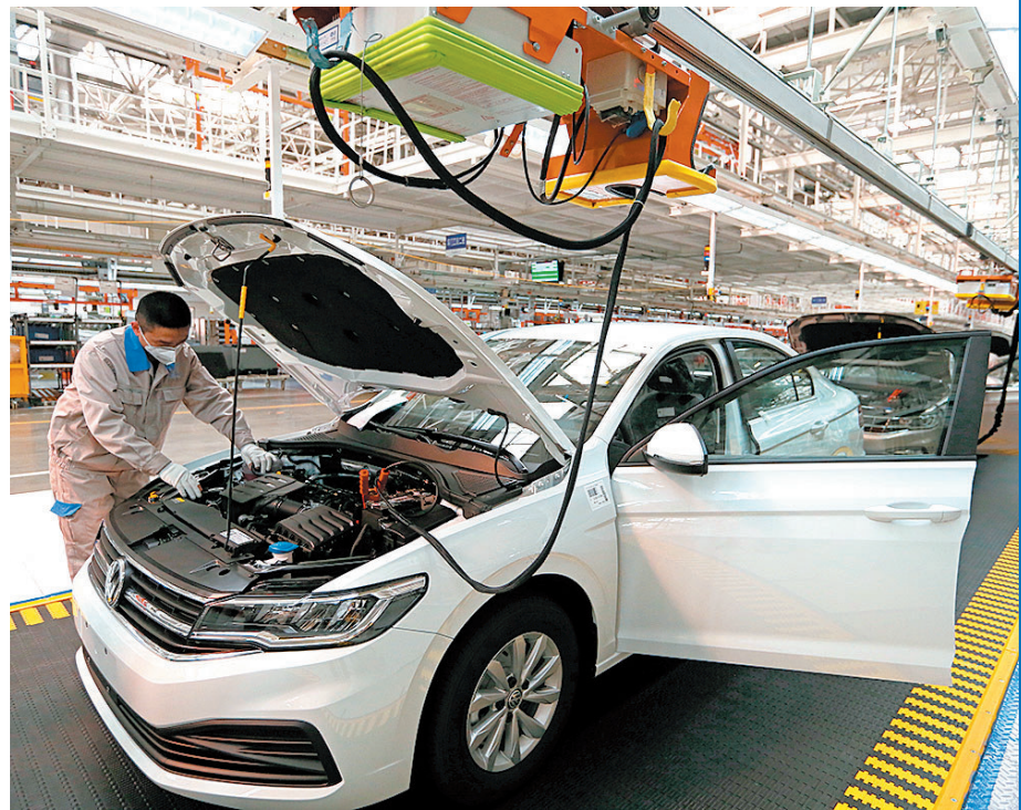
■一汽-大众华东生产基地生产线。