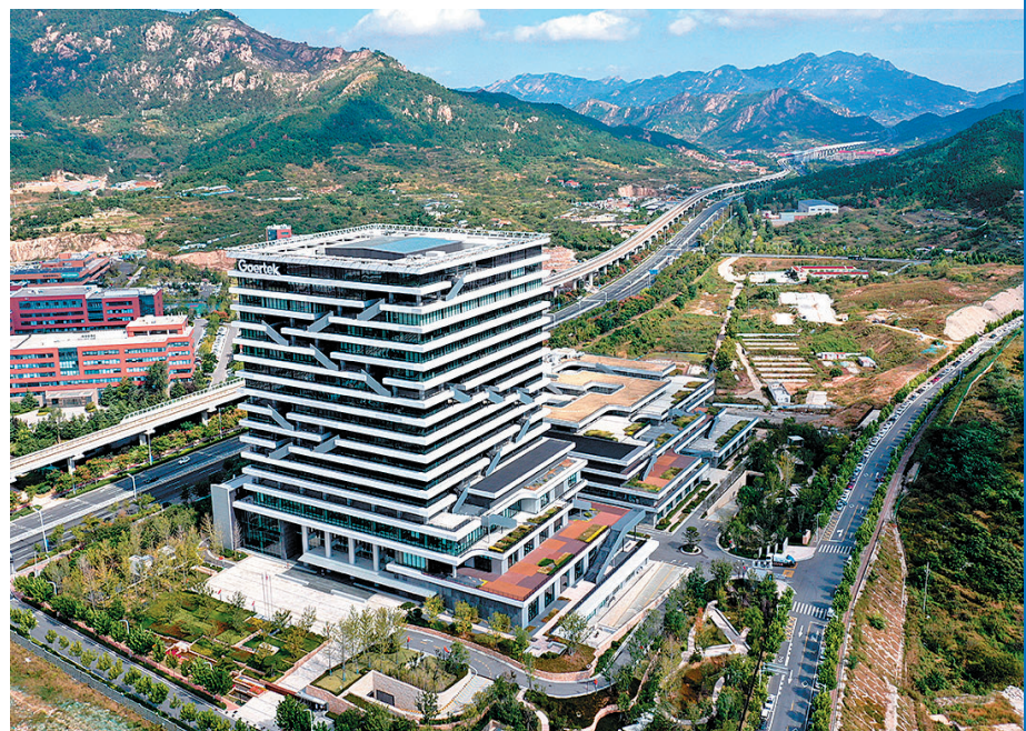
■崂山区虚拟现实产业园汇集了歌尔等龙头企业。