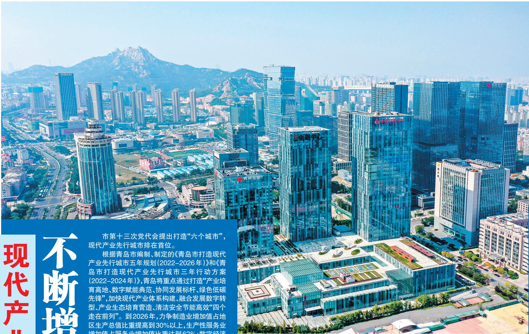
■金家岭金融区吸引许多现代金融企业落户。