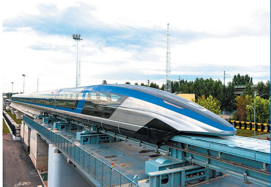
■2021年7月20日,由中国中车承担研制、具有完全自主知识产权的我国时速600公里高速磁浮交通系统在青岛成功下线。