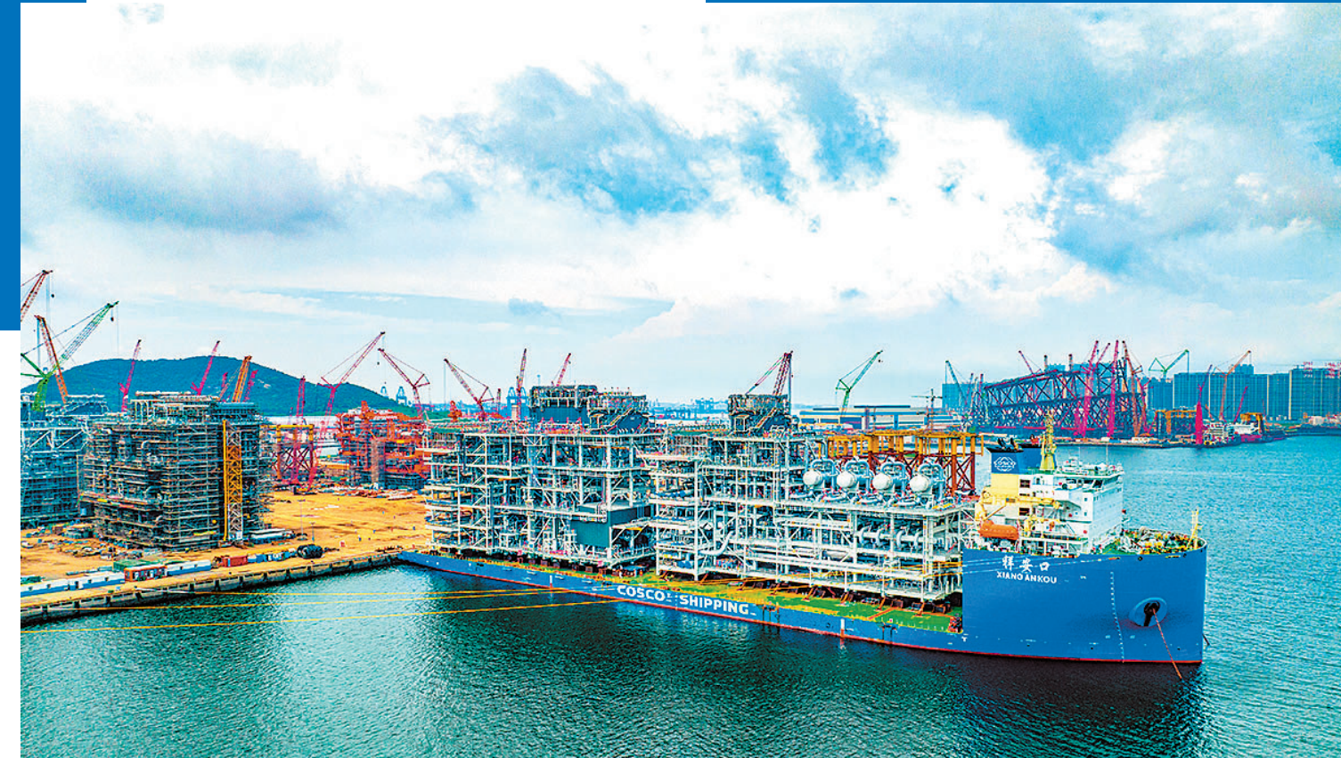
■青岛海工装备产业逐步向价值链中高端攀升。图为中海油青岛海工建造交付的LNG项目模块。