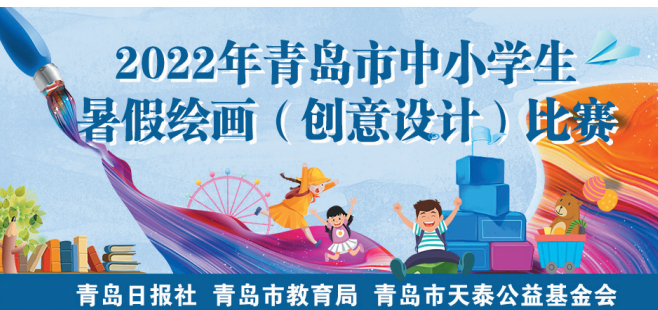
青岛日报社 青岛市教育局 青岛市天泰公益基金会