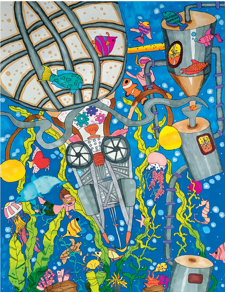
■《海底啤酒厂》 青岛敦化路小学六年级 范雯平