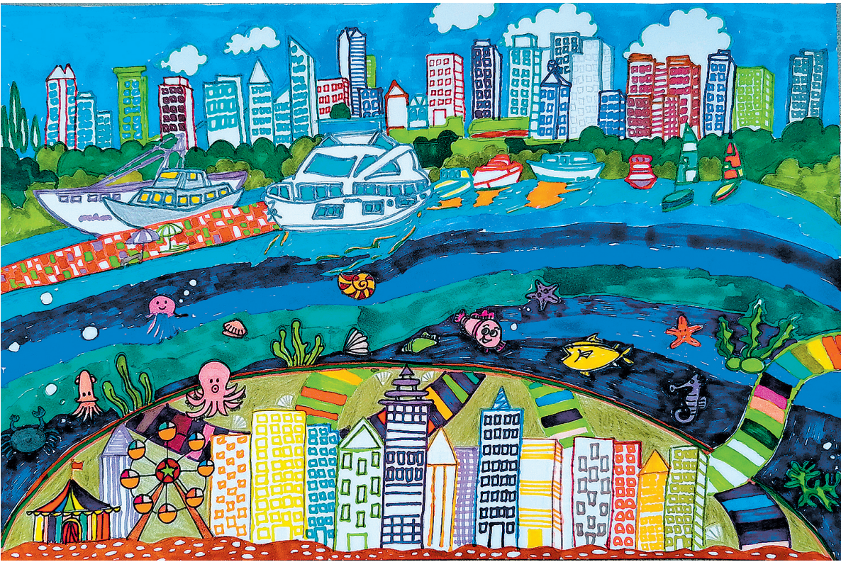
■《海底城市》 青岛辽源路小学 三年级 刘润泽