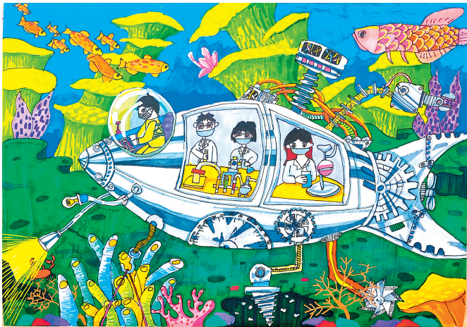
■《移动科学考察站》 青岛金门路小学三年级 于辰锐