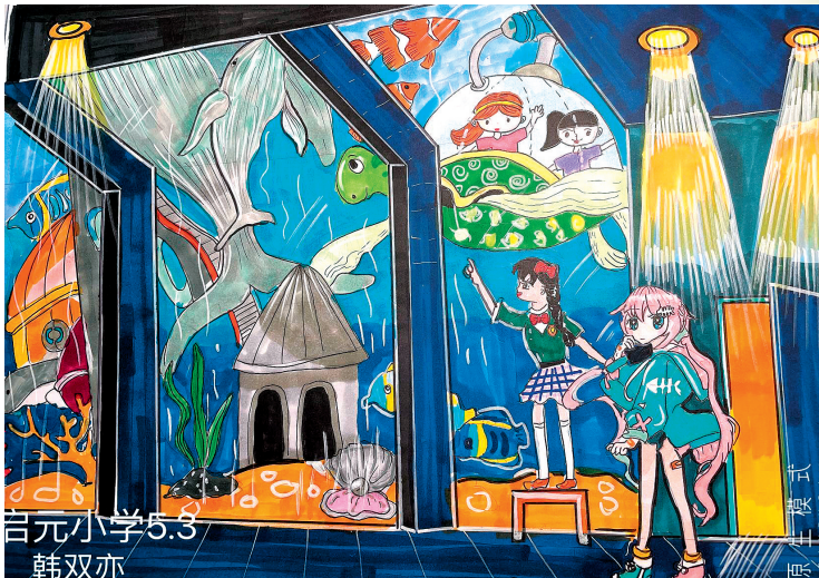
■《海底家园》 青岛启元学校五年级 韩双亦