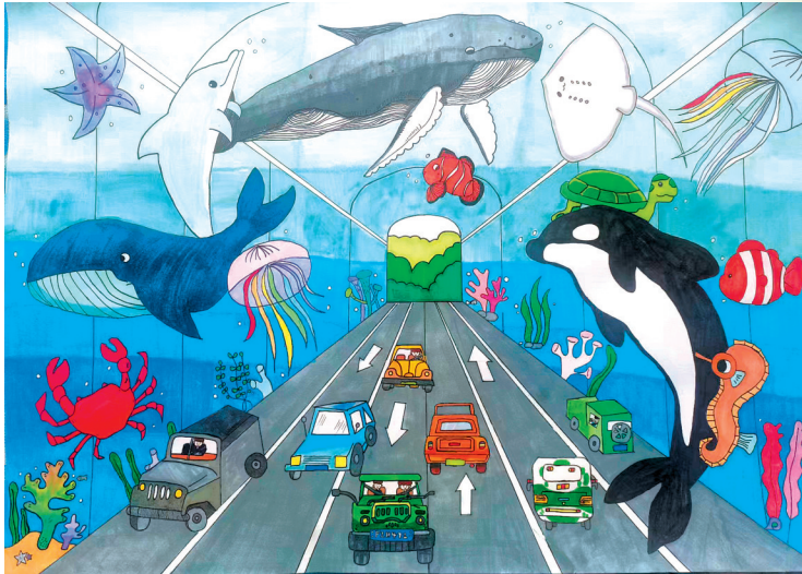
■《未来海底隧道》 青岛宁夏路小学五年级 姜怡萱