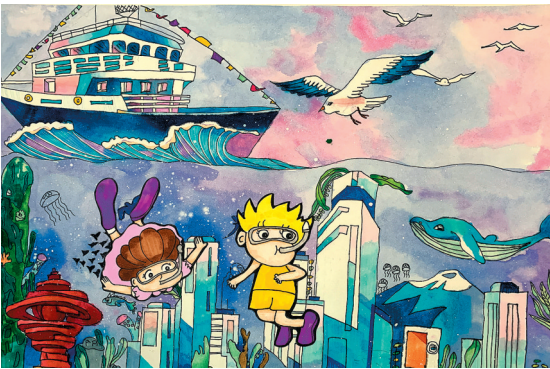
■《探索新大陆》 青岛鞍山二路 小学2019级 韩嘉源