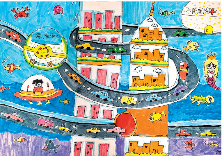
■《海洋家园》 青岛志远学校二年级 洪月晴