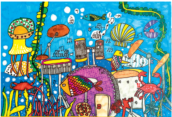
■《海底音乐厅》 青岛合肥路小学二年级 于睿峰