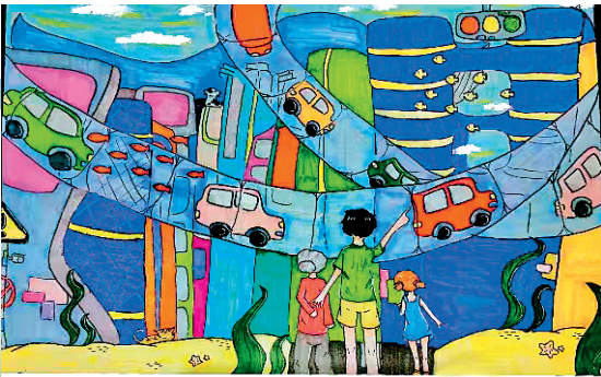
■《大海,我的故乡》 崂山区育才学校 六年级 程昱萱