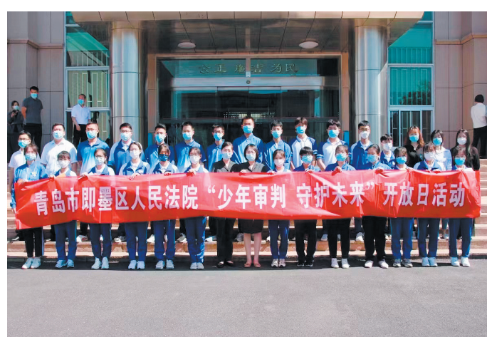
▲即墨法院开展少年法庭开放日活动。 ▲即墨法院组织党员干部参观即墨区廉政教育馆。

精细化管理激发新潜能。推动党小组建设与审判团队建设、案件研讨会相结合，把党的管理延伸到工作末端、审判一线。推行精细化审判管理，坚持“日过问、周通报、月分析、季总结、年度考核”的审判管理长效机制，将办案任务分解到员额法官、细化到周，每周公示员额法官指