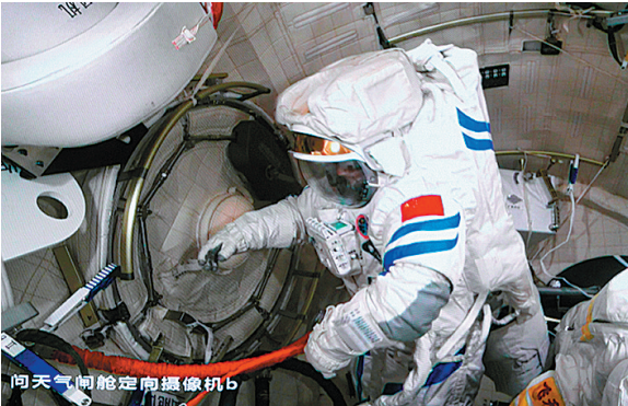
■9月1日在北京航天飞行控制中心拍摄的航天员陈冬准备打开问天实验舱气闸舱出舱舱门的画面。