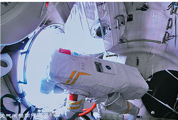
■9月1日在北京航天飞行控制中心拍摄的航天员刘洋正在出舱的画面。