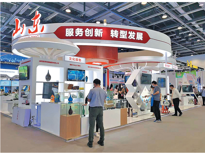
■2022年服贸会山东展区。