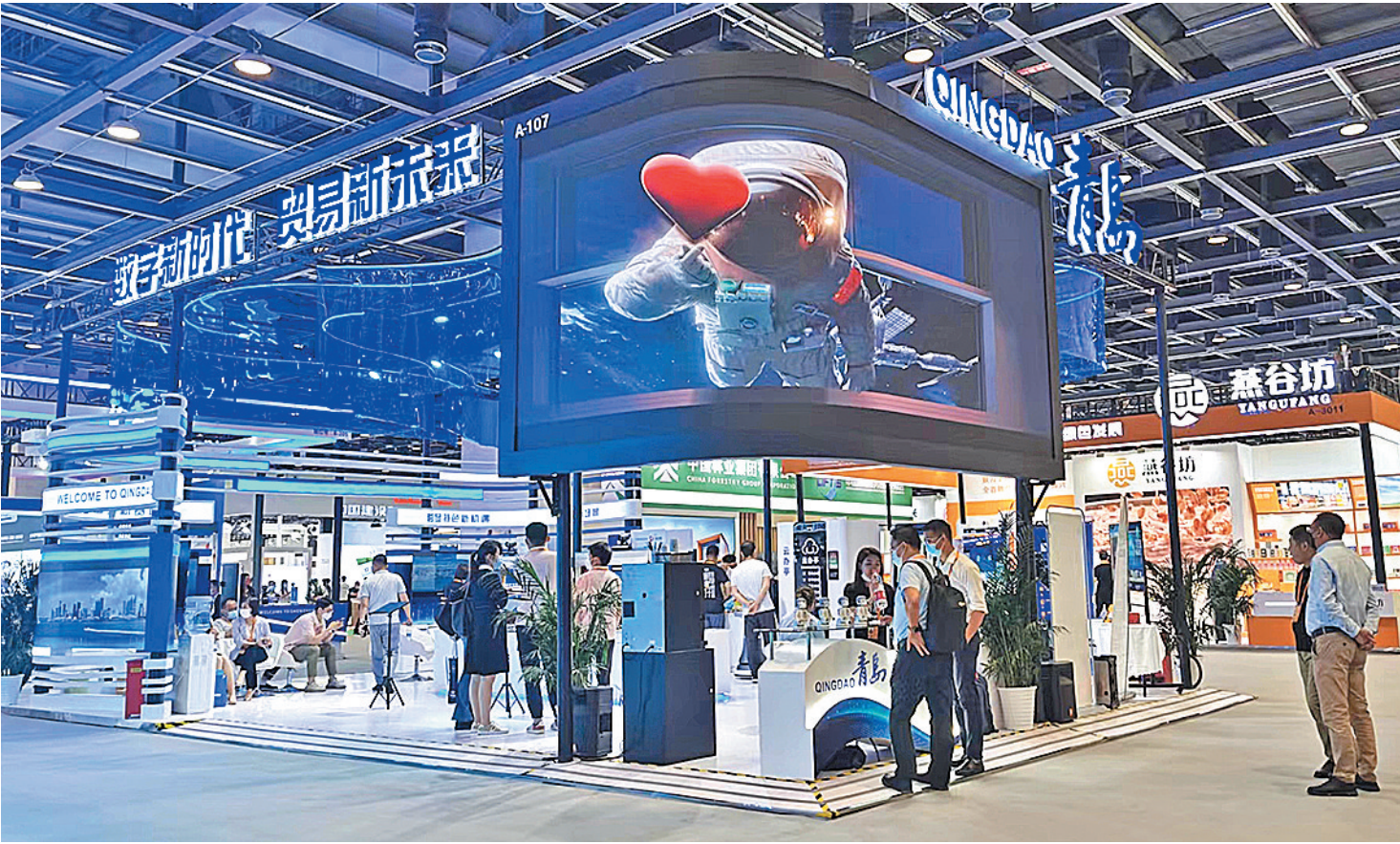
■2022年服贸会青岛展区。