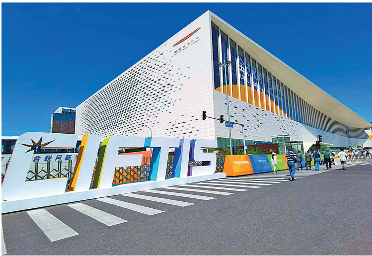
■2022年服贸会场馆外景。