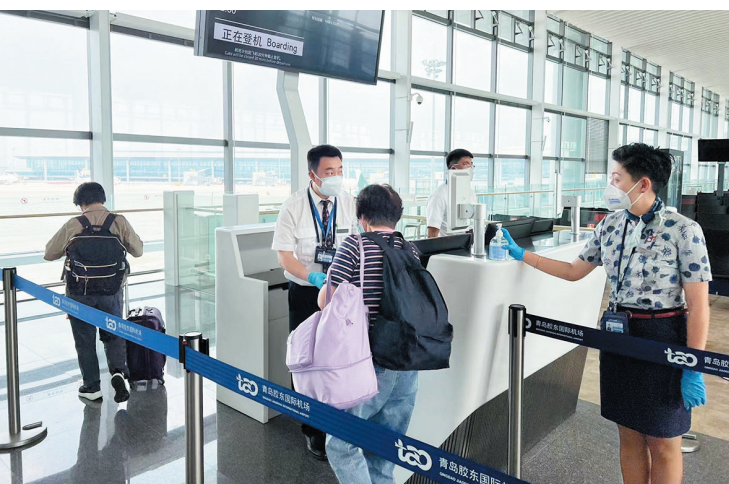
■飞往大阪的旅客正在有序办理乘机手续。

自2020年疫情发生以来停航的首都航空青岛—伦敦航线按下“重启键”,将于8月19日复航。该航线恢复后,将为中英