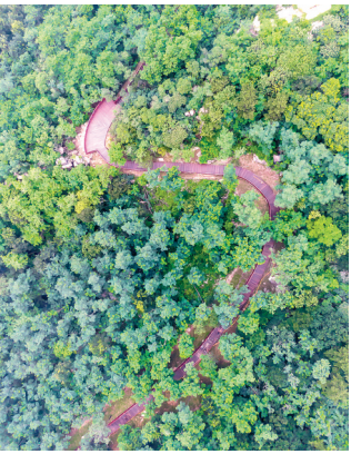
■在太平山上，一条沿山势绵延向上的登高观景线掩映在繁茂的植被当中。