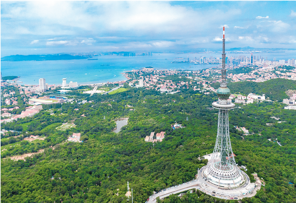
▲浮山是青岛城市建成区最大的一片山林绿地。