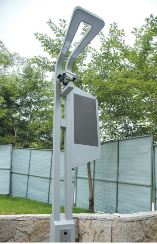
■浮山市南段防火通道（绿道）安装的智慧路灯。

据了解，目前，浮山防火通道（绿道）改造提升工程、太平山中央公园生态绿道建设正压茬推进。浮山绿道计划9月底前基本贯通；太平山最美花道环、溯源绿道环、全民阳光绿道环和登高观景线预计9月底前完工，环山绿道计划2022年年底前基本完成贯通，2023年3月底前向市民开放。