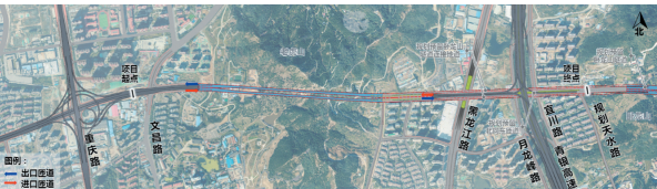
■项目初步方案示意图。