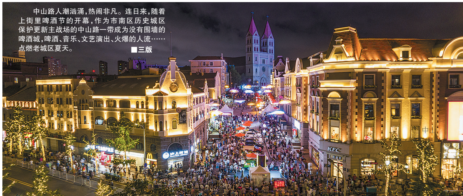
中山路人潮汹涌,热闹非凡。连日来,随着上街里啤酒节的开幕,作为市南区历史文化保护更新主战场的中山路一带成为没有围墙的啤酒城,啤酒、音乐、文艺演出、火爆的人流……点燃老城区夏天。 ■三版

专家组一行实地调研了即墨区鳌山卫街道鳌角石村、龙泉街道党建引领乡村共同富裕示范片区,深入了解党组织引领产业发展,推动党建统领乡村公共资源共享行动等情况,听取了推行“农业公司+村集体经济”一体化发展机制、建设共同富裕产业园区有关情况介绍;实地考察了莱西市院上镇农民专业合作社联合社、岈沽新村。 （下转第六版）