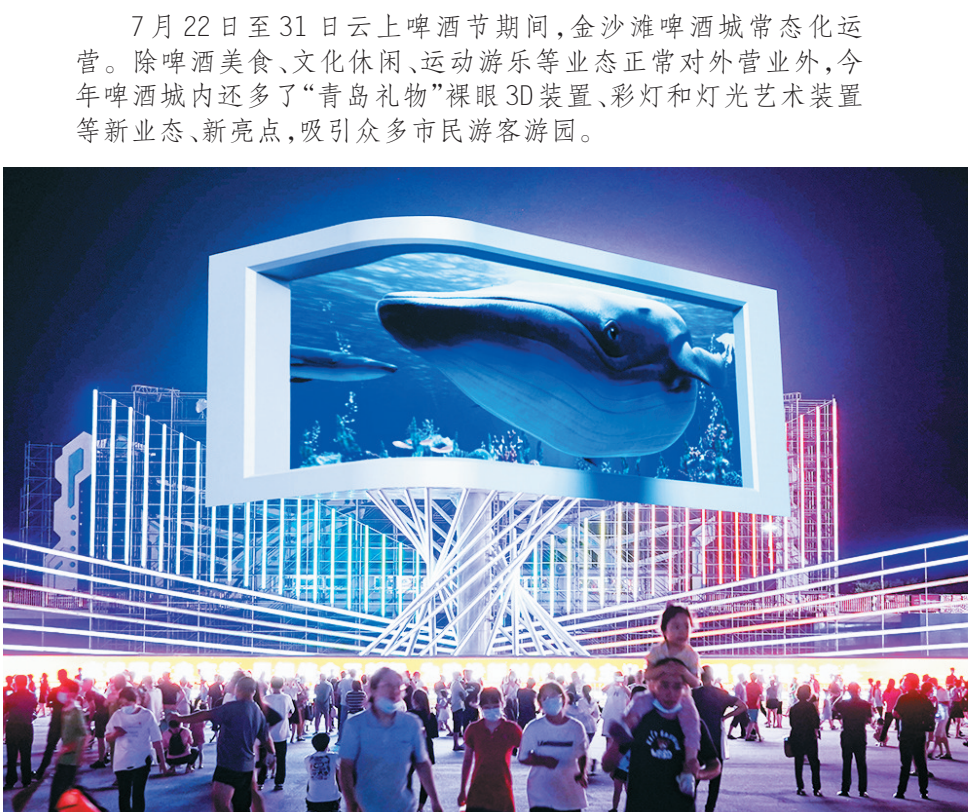
■“青岛礼物”裸眼3D吸引游客驻足。

金沙滩啤酒城内,主入口两侧是“哈舅迎宾”灯组,该灯组以哈舅IP、海洋、啤酒为主元素,配以流动光效,迎接宾客到来。移步进入星光大道,最显眼的当属庆典花篮灯组,该灯组以线条感、冰晶感的现代时尚手法设计而成,花篮顶部花朵造型采用导光纱布加追光灯带,实现花瓣的动感轮廓和光效渐变的时尚氛围效果。 星光大道两侧是多个海洋灯组拱门,这让不少小朋友驻足流连。记者看到,北边两组以卡通造型的贝壳、水母为主元素,搭配海星、海马等元素设计而成;南边两组则以《山海经》中的“鲲”“文鳐鱼”等为主元素,设计出极具中国