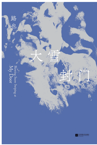
《大雪封门》 路也 著 江苏凤凰文艺出版社

作为土生土长的红岛渔民后代，昔日自己生活的小渔村里的奇闻轶事，盛文强信手拈来：砍断了脖颈用鱼皮裹起来起死回生的人；脸被章鱼爪粘住，连皮硬拽下来变成阴阳脸的怪人；各种擅用渔具的好手拥有的奇遇，被打捞上来的奇怪的海洋生物……“我们对于海洋其实并不太熟悉，更多还是抒发农耕文明时代对于粮食和庄稼的情感。”在他看来，农耕文明是一种相对封闭和固化思维的代言，春耕秋收的循环本身就跟因循守旧的思想观念关联，导致很难接受新鲜事物，而海边生活的人因为地处海岸码头，信息交汇，相对开放。