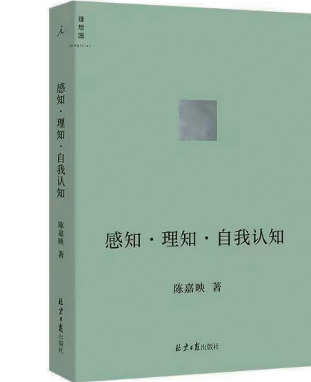
《感知·理知·自我认知》 陈嘉映 著 北京日报出版社