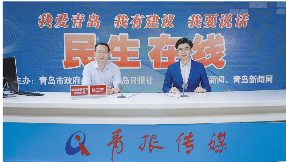
■市行政审批局党组书记、局长路玉军做客民生在线。

如何解决办事窗口排长龙问题？外籍人员语言不通怎么办？想变更公司名称怎么办？……7月14日下午，市行政审批局党组书记、局长路玉军做客民生在线，围绕“提升作风能力、优化审批服务、打造一流营商环境”主题与网友在线交流。