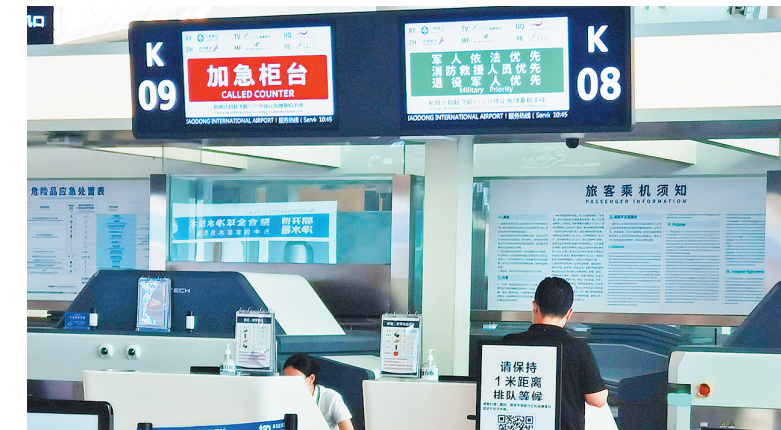
■胶东国际机场值机柜台设立了退役军人绿色通道。

青岛国际机场退役军人优待项目是在对现役军人依法优先的基础上，在全国率先推出的对退役军人的优先服务，胶东国际机场在值机、安检、登机工位设立了专门的绿色通道。退役军人