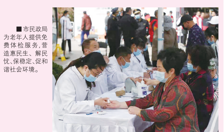
■市民政局为老年人提供免费体检服务,营造惠民生、解民忧、保稳定、促进和谐社会环境。