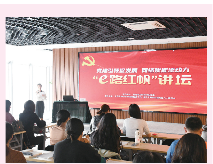
■市委网信办举办“e路红帆”讲坛,以党建引领增发展动力。

法治兴则国兴,法治强则国强。市直机关各级党组织和广大党员干部强化法治意识、规矩意识,持续推进法治青岛建设,把制度优势转化为治理效能。