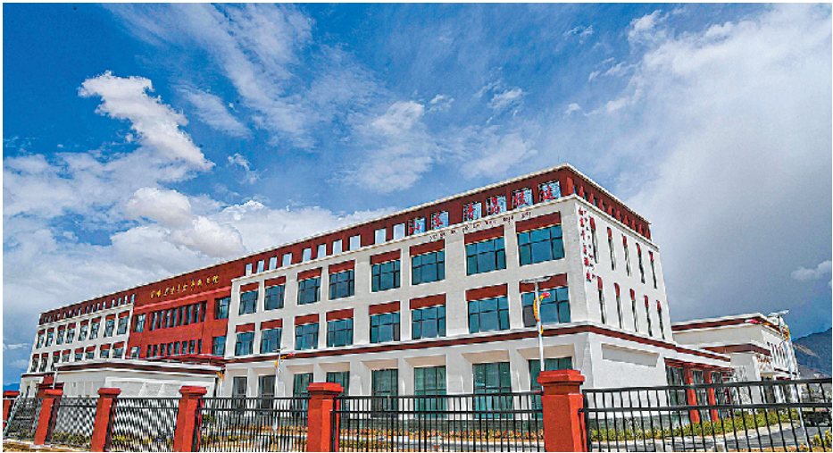
■青岛援建的日喀则市青少年科学院。

加强中华民族大团结,长远和根本的是增强文化认同,建设各民族共有精神家园,积极培养中华民族共同体意识。 自进藏以来,青岛市第九批援藏干部组聚焦智力援藏、文化援藏,大力实施智慧点亮行动,围绕铸牢中华民族共同体意识,突出重点领域,积极做到文化上兼容并蓄、经济上相互依存、情感上相互亲近,通过文化共建挖掘本土文化资源,通过交往交流交融不断丰富文化共建内涵,拓展文化共建领域。 江当现代生态产业示范园范围内,日喀则市青少年科学院项目即将完工面向社会开放。“这是青岛援藏史上单体投资最大的项目,占地 43 亩,总投资达到 7300 万元。”青岛市第九批援藏干部、桑珠孜区发改委副主任王鹏告诉记者,日喀则市青少年科学院将依托江当现代生态产业示范园内丰富的农业、工业、手工业、生态、文化、旅游等资源,计划安排全桑珠孜区中小学每学期在此寄宿学习一周,“这也是西藏首所集科技、国防、思政、劳动、研学、艺术等为一体的综合实践教育中心。”与日喀则市青少年科学院一体建设的,还有西藏首座少年军校、西藏首座海洋科普馆、西藏首座黑颈鹤保护区。 在青岛援藏组积极联系下,在共青团西藏自治区委员会、当地驻军、青岛市教育局、青岛市科协的大力帮助下,依托西藏自治区国防、驻军和青岛海洋文化与“海军城”的国防教育资源,日喀则市少年军校将开展陆海空一体国防教育,打造日喀则市青少年强边、固边教育阵地。 为了满足日喀则市民特别是青少年对海洋知识的渴求,激发他们亲海、爱海、知海、探海的热情,在青岛援藏组的协调沟通下,青岛海洋科技馆与日喀则市桑珠孜区教育局共建了日喀则市青少年科学院海洋科普馆。海洋科普馆面积共约 108 平方米,将展出包括海洋植物、鱼类、哺乳类等各种海洋生物在内的标本 110 余件。海洋牧场、海上龙卷风、机器鱼等针对海洋方面的定制互动科普仪器,则可供孩子们操作、互动,进而让他们更加深切地了解海洋知识。 黑颈鹤被称为“鸟类大熊猫”,主要分布在中国,是我国一级保护动物,也是唯一终生生