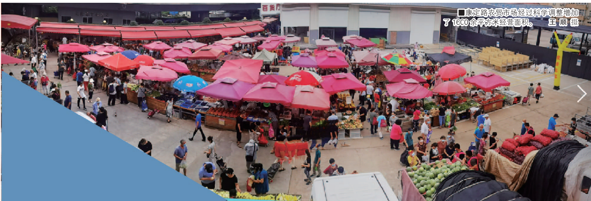
康定路农贸市场经过科学调整增加了1600余平方米经营面积。

小市场关系大民生。今年,市北区将“实施农贸市场规范化提升行动,推进10处农贸市场升级改造”纳入区办实事,让居民从“菜篮子”里感受到幸福感的提升。