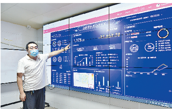
“智能化”将成为农贸市场下一步的改造方向。