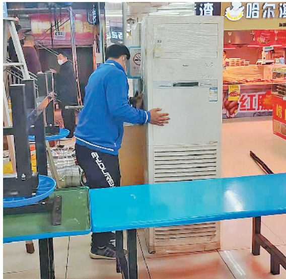
益欣市场加装空调,为消费者创造凉爽舒适的消费环境。

市北区市场监管局介绍,今年市北计划改造10处农贸市场,截至目前,海云庵农贸市场、康定路市场已完成扩建升级,益欣市场、丰华锦市场已完成局部改造,粮油综合批发市场公厕、抚顺路批发市场快检室已实现更新,累计完成6家农贸市场整体或局部改造,占全年升级改造总数的60%。