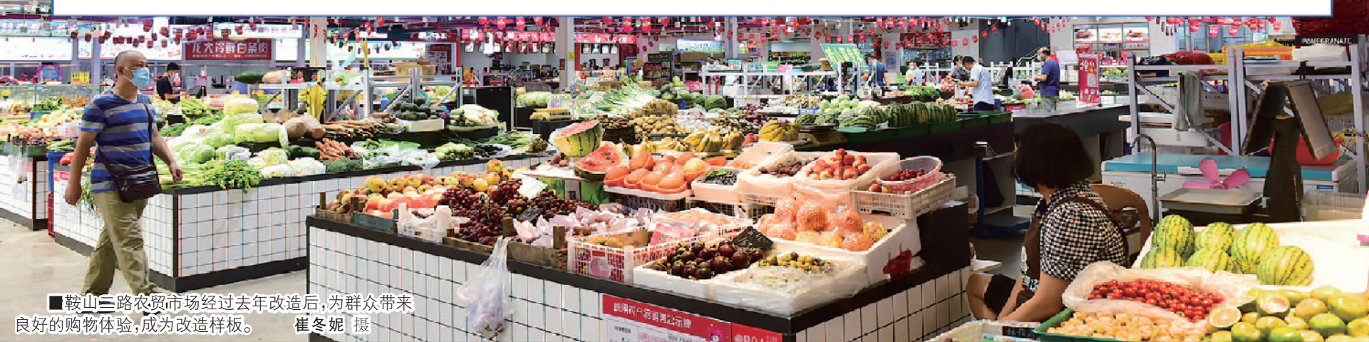
鞍山三路农贸市场经过去年改造后,为群众带来良好的购物体验,成为改造样板。

据了解,市北区在原有社区教育区街居三级线下教育培训机构、学分银行线上教育网络平台的基础上,组织发动辖区职业学校、教育培训机构、老年健康服务机构、地方银行等,签约组建市北区社区老年教育联盟,助力社区老年人跨越数字鸿沟,融入现代数字化社会。联盟成员单位将提供各自专业领域的课程服务,共同承担市北区社区老年教育示范基地的职责。基地启用后,将首先在全区普及老年人学习智能手机的课程。(周伟年 卢勇)