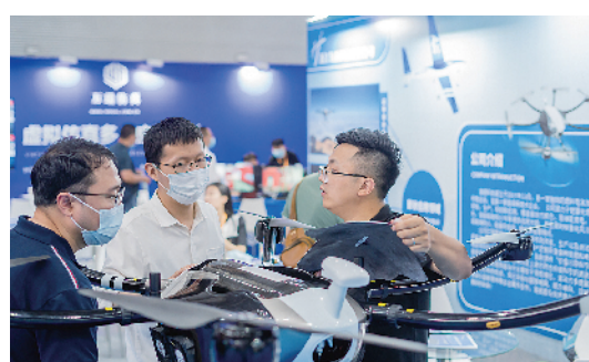
■海博会展出的氢旋4号长航时多旋翼无人机。

青岛西海岸新区也首次借助海博会平台,举办了一场头部企业“双招双引”推介会,邀请中化学华陆新材料、金通灵科技集团等20余家重点参展企业。同时,精准匹配具有很高行业关联度、合