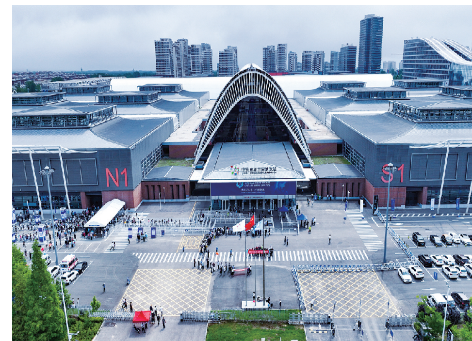
■6月21日至23日,2022东亚海洋博览会在中铁青岛世界博览城举行。