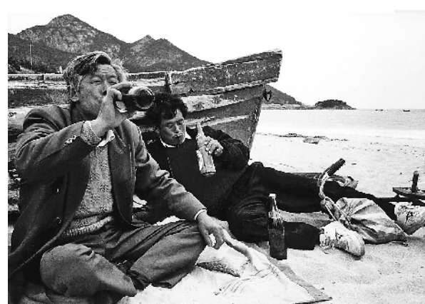
■上世纪九十年代,两位青岛市民躺在沙滩上喝啤酒。