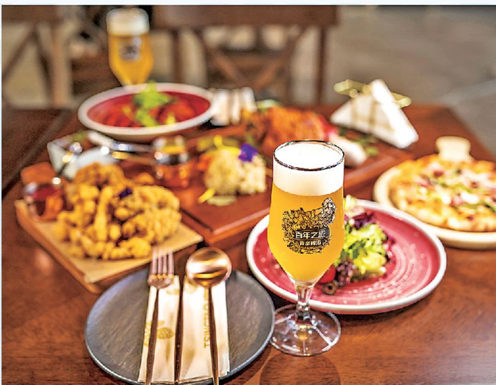
■160多道啤酒文化融合菜,打造啤酒全宴。