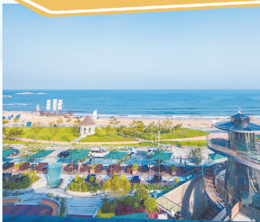
■拥有一线海景视野的海风露台。