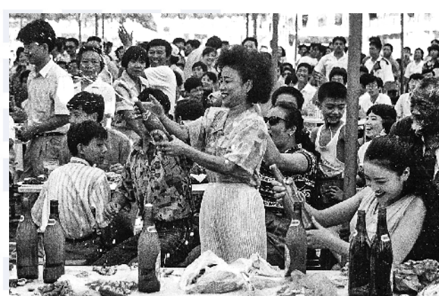
■1992年,这种打扮时髦的女士在大庭广众之下喝酒的很少见。