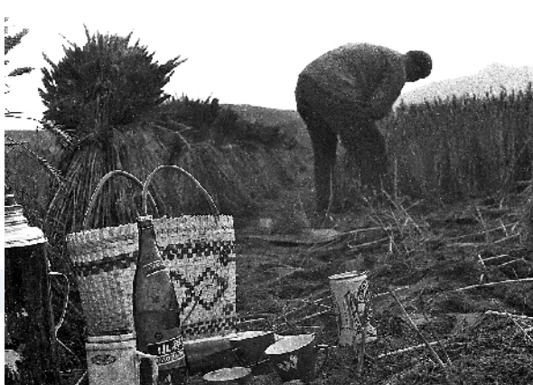
■1986年,一农户制麦时准备了一罐青岛啤酒。