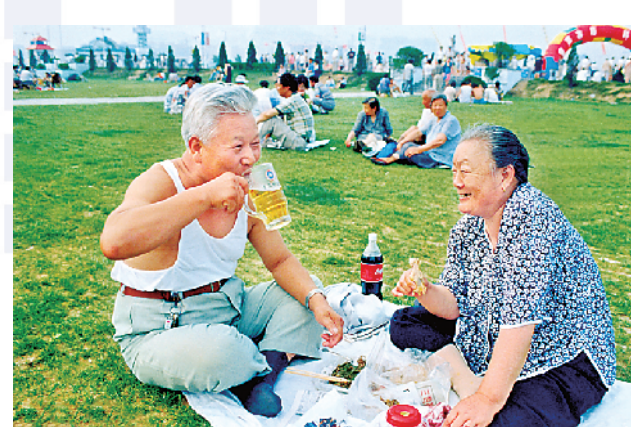
■1997年,老两口在草地上喝酒。