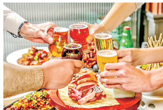
■青岛啤酒种类多样,消费者可挑选自己喜欢的。