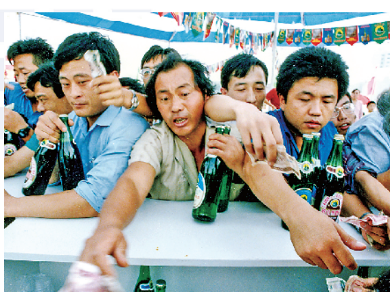
■1992年,第二届青岛国际啤酒节期间,当时买酒是限量的。