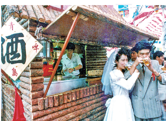
■1992年,一对新婚夫妇在啤酒节接受大家的祝福。