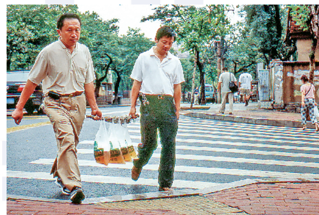
■2009年街头一幕。对外地人而言,塑料袋装啤酒的确是奇特。