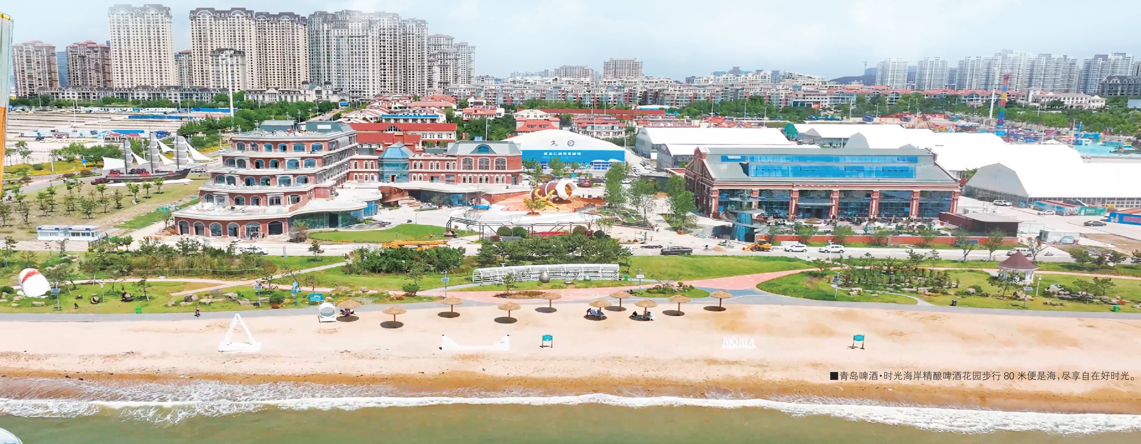
■青岛啤酒·时光海岸精酿啤酒花园步行80米便是海,尽享自在好时光。