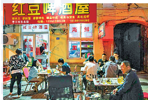
■2019年,黄岛路的夏夜。