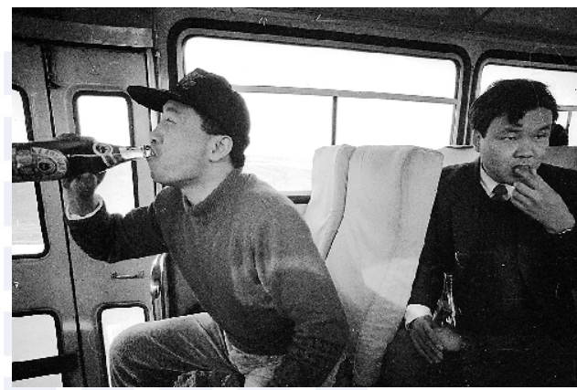
■1995年从青岛到济南的长途车上,一位青岛摄影家正在“吹瓶”。