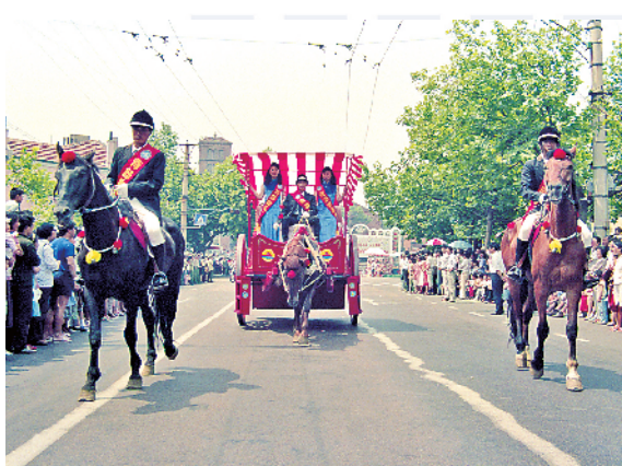
■1991年首届青岛国际啤酒节马车巡游。