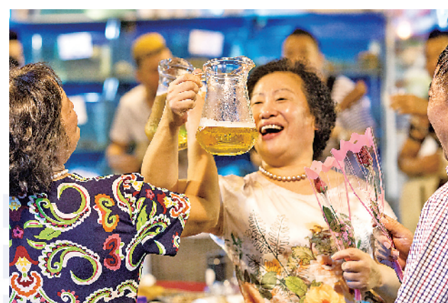
■青岛大姨在青岛啤酒博物馆音乐餐吧里,举杯畅饮。