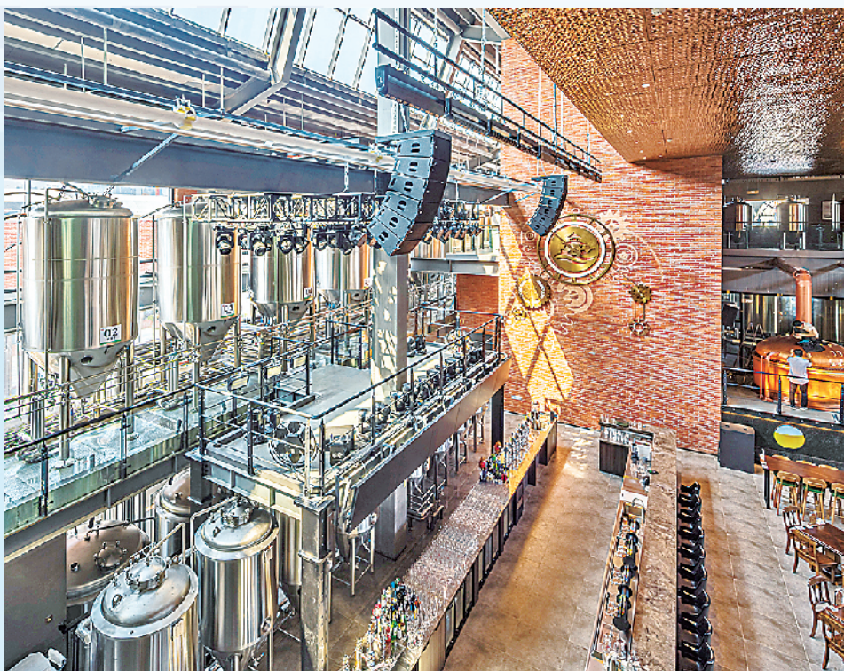
■光影下的精酿工坊,独具魅力。