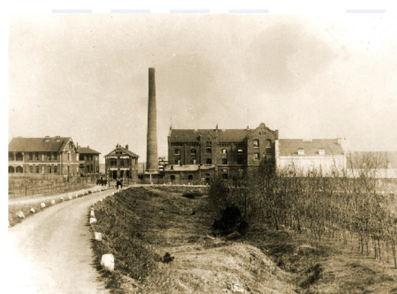
■青岛啤酒厂建厂初期的厂貌。