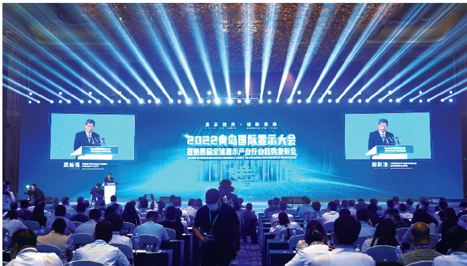
6月23日上午,2022青岛国际显示大会暨第四届全球显示产业行业趋势发布会在西海岸新区举行。

陆治原说,青岛是中国沿海重要中心城市,综合实力突出、产业基础雄厚、科创资源丰富,正加快打造现代产业先行城市。习近平总书记指出,要聚焦集成电路、新型显示、通信设备、智能硬件等重点领域,培育一批具有国际竞争力的大企业和具有产业链控制力的生态主导型企业。我们将聚焦打造国内重要的新型显示产业基地,强化产业链培育,做好建链、聚链、延链、强链文章,不断集聚产业资源,营造合作共赢的良好产业生态。突出企业创新主体地位,推动产学研深度融合,促进技术创新和成