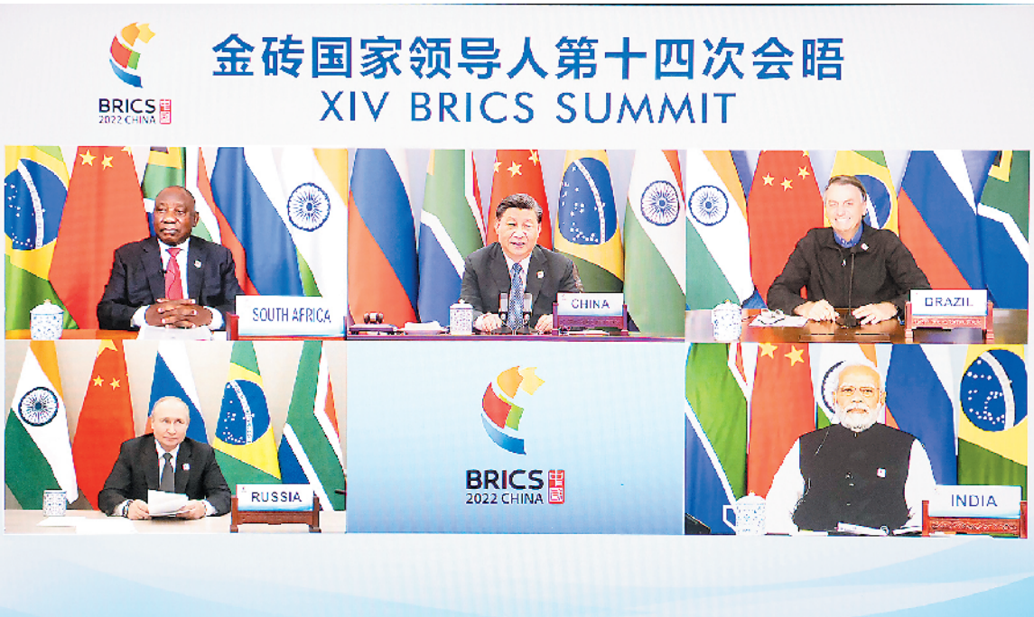
6月23日晚,国家主席习近平在北京以视频方式主持金砖国家领导人第十四次会晤并发表重要讲话。南非总统拉马福萨、巴西总统博索纳罗、俄罗斯总统普京、印度总理莫迪出席。

新华社北京6月23日电(记者杨依军)国家主席习近平23日晚在北京以视频方式主持金砖国家领导人第十四次会晤。南非总统拉马福萨、巴西总统博索纳罗、俄罗斯总统普京、印度总理莫迪出席。 人民大会堂东大厅花团锦簇,金砖五国国旗整齐排列,与金砖标识交相辉映。 晚8时许,金砖五国领导人集体“云合影”,会晤开始。